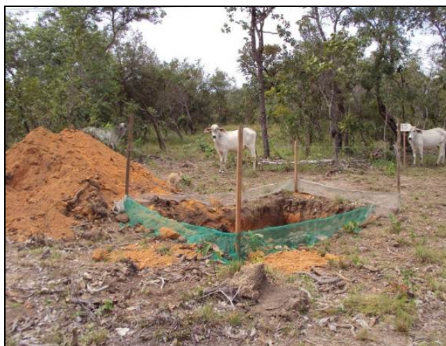
Figura 3.6.9.2.1-1 - Cercamento de cavas de fundações

As escavações em áreas alagadas/alagáveis devem ser realizadas prioritariamente na época de seca.