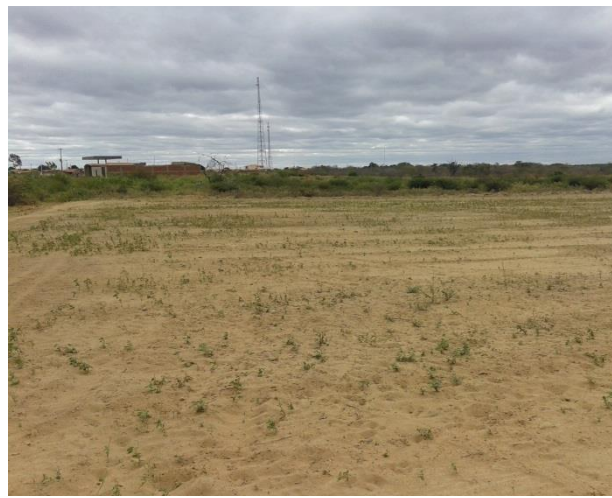
Figura 4 – Área em análise – São Francisco de Assis do Piauí 01