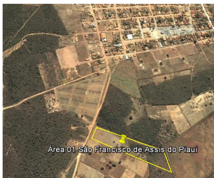
Figura 1 - Localização do canteiro de Obra " São Francisco de Assis do Piauí 01" .

A área do canteiro de obra “São Francisco de Assis do Piauí 01” está localizada no município de São Francisco de Assis do Piauí, no estado do Piauí, zona rural, próximo à estrada uma estrada vicinal, a 500 metros do centro do município aproximadamente, sob as coordenadas DATUM SIRGAS2000 203.829E / 9.087.830N (Figura 1), fuso 24.