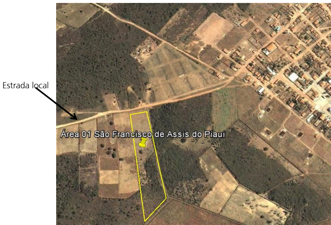
Figura 2 - Acesso ao canteiro de Obra

O principal acesso ao canteiro de obras “São Francisco de Assis do Piauí 01” é estrada local, que é acesso a área urbana do município BR-020 (Figura 2).