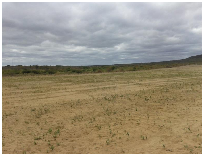
Figura 5 - Área em análise – São Francisco de Assis do Piauí 01