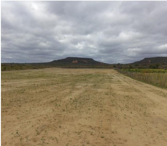
Figura 3 - Área em análise – São Francisco de Assis do Piauí 01