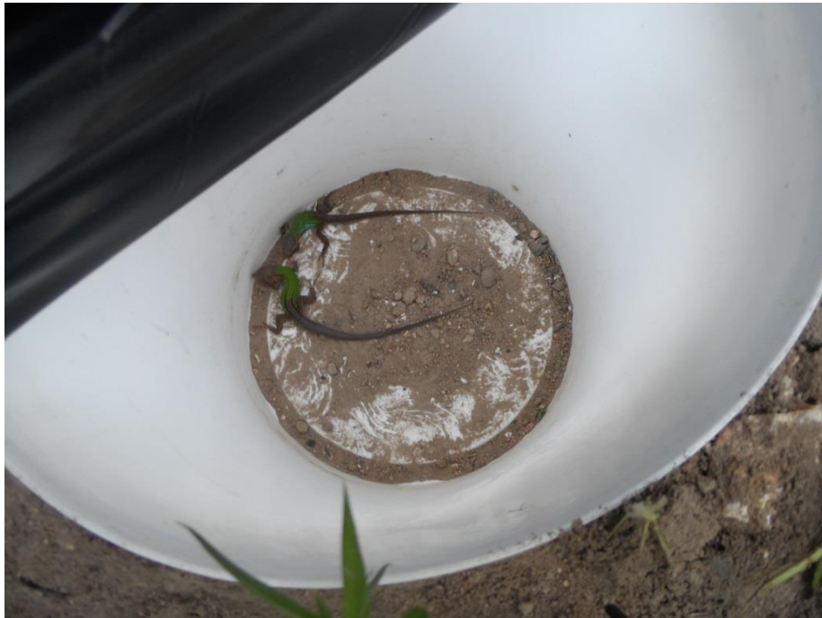
Registro Fotográfico 06 – Réptil localizado na área.