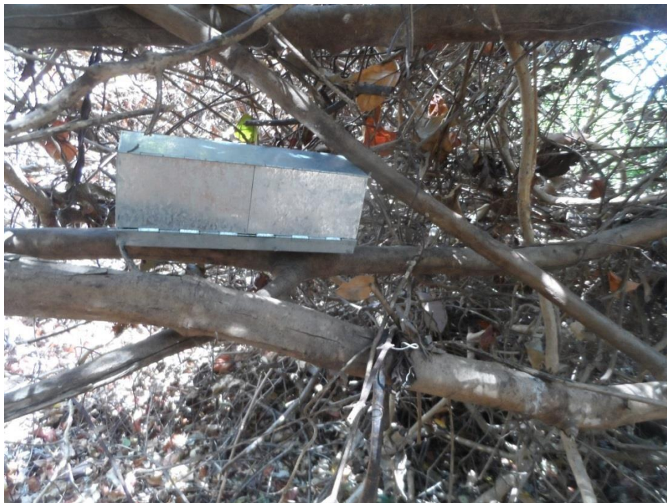
✓ Registro Fotográfico 14: Armadilhas de captura do tipo SHERMAN.