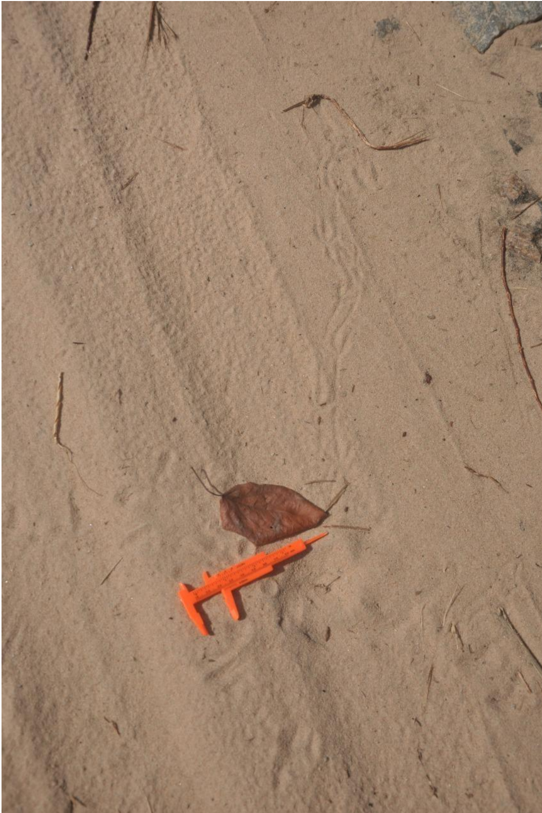
✓ Registro Fotográfico 27 - Pegadas de animais registrados na área.