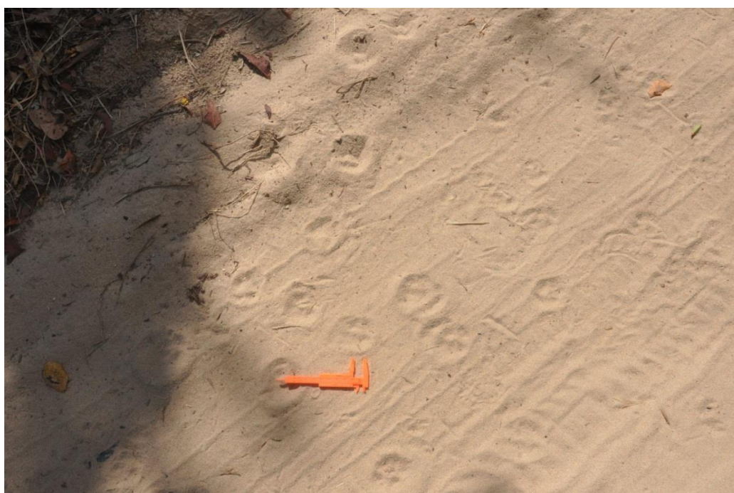
✓ Registro Fotográfico 29 – Pegadas de animais registrados na área.