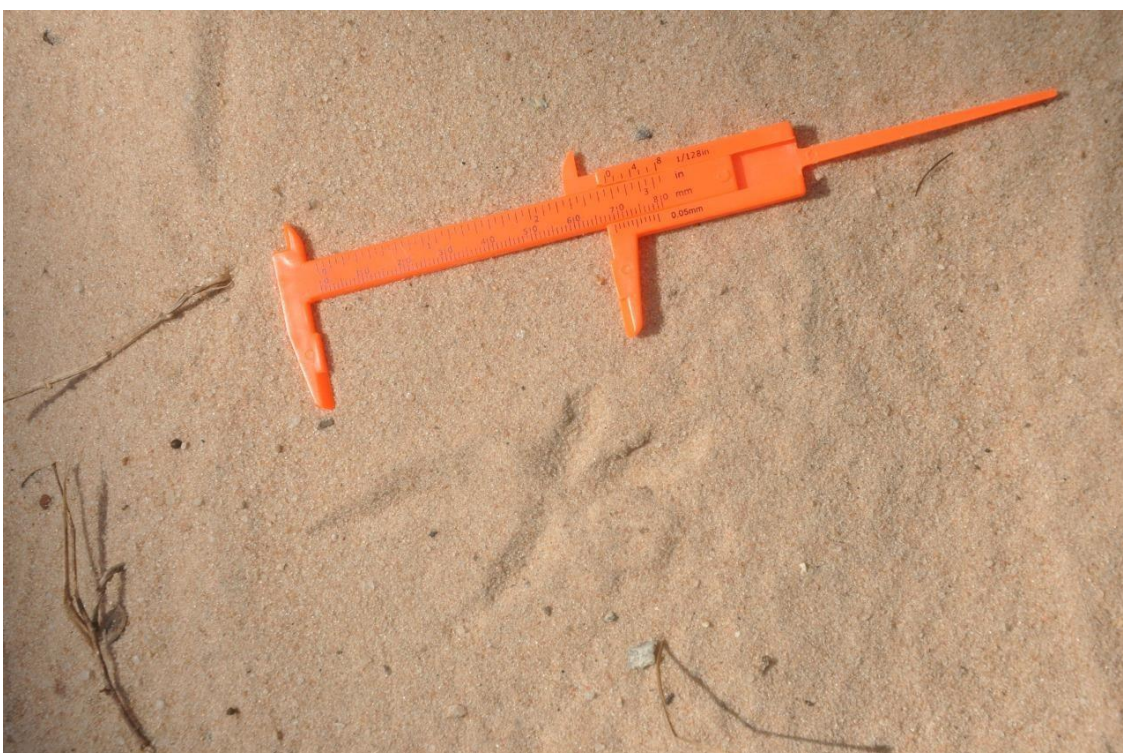
✓ Registro Fotográfico 26 – Pegadas de animais registrados na área.