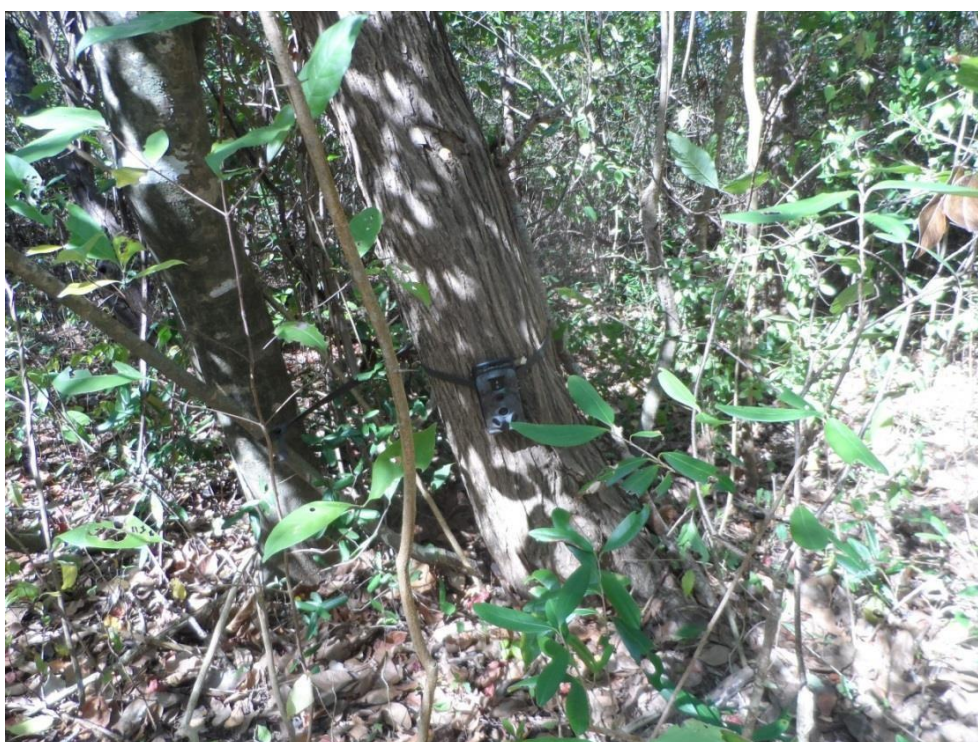
✓ Registro Fotográfico 15 - Instalação de armadilhas fotográficas na área.