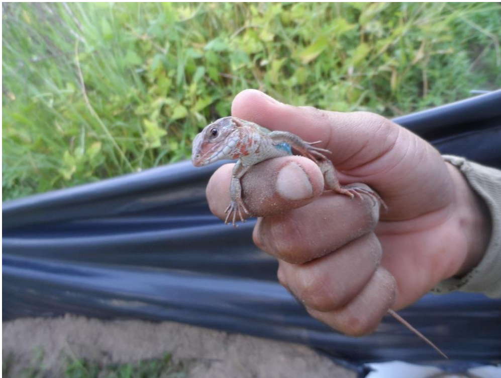
Registro Fotográfico 7 - Animais capturados no "PITFALL".