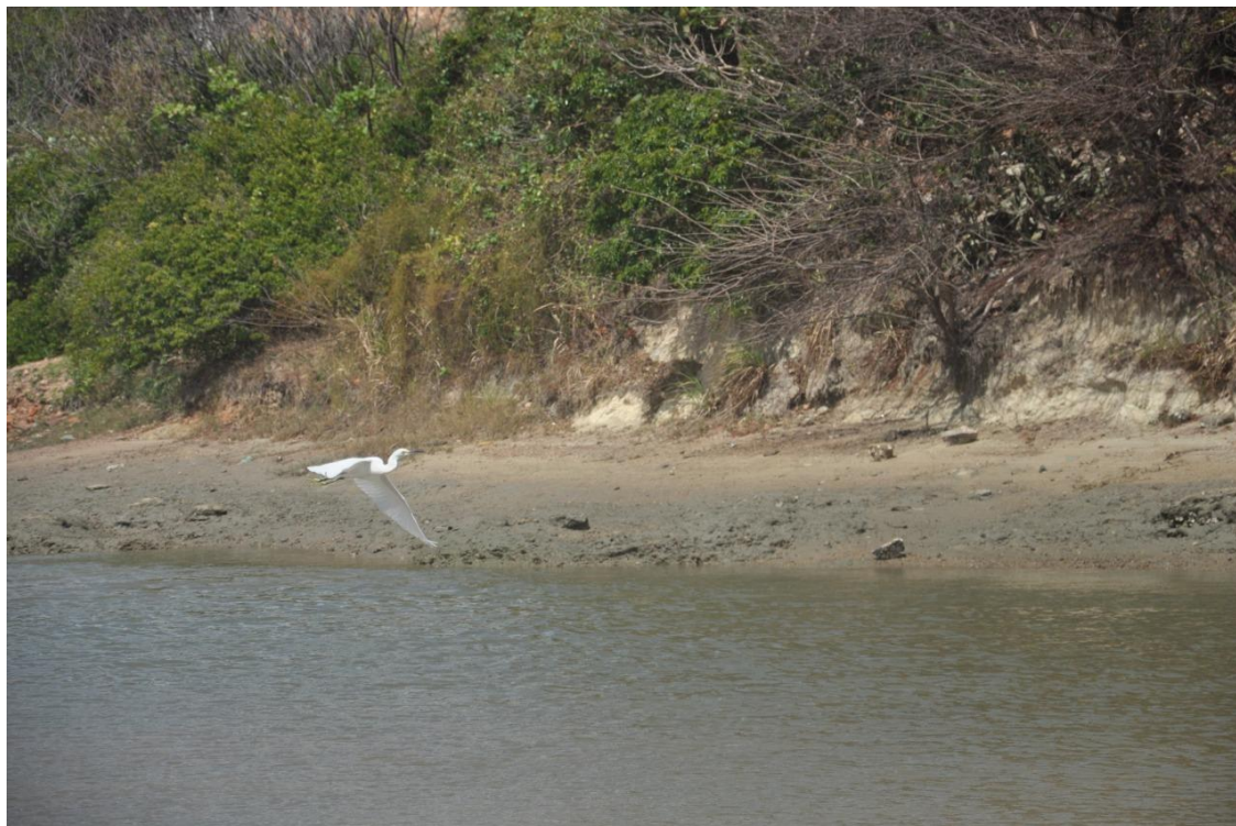
✓ Registro Fotográfico 25 - Animais registrados na área.