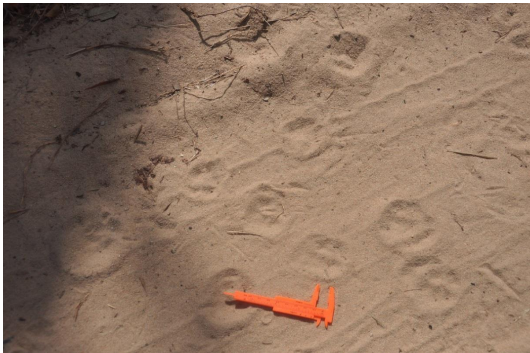
✓ Registro Fotográfico 28 – Pegadas de animais registrados na área.