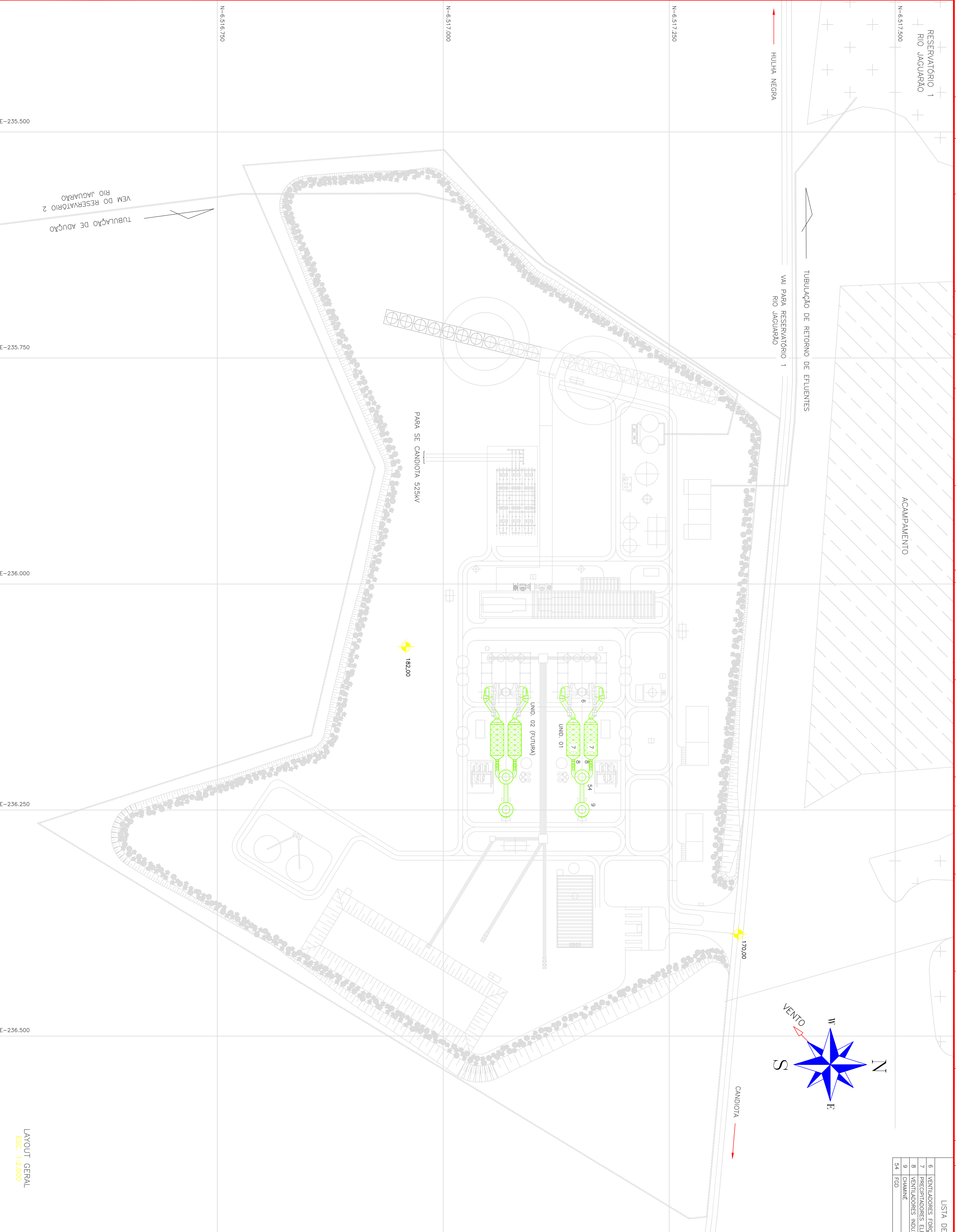
LAYOUT GERAL ESC.: 1:2.000