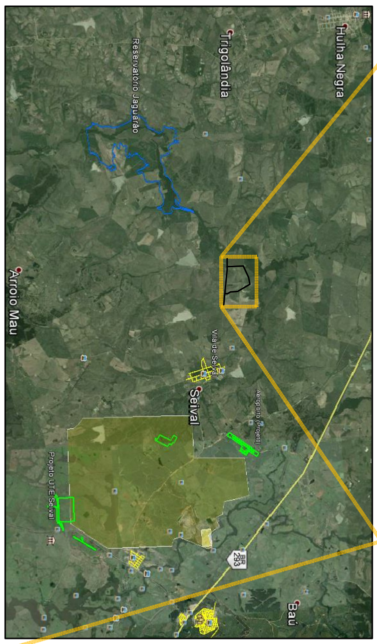
LAYOUT GERAL S/ ESC