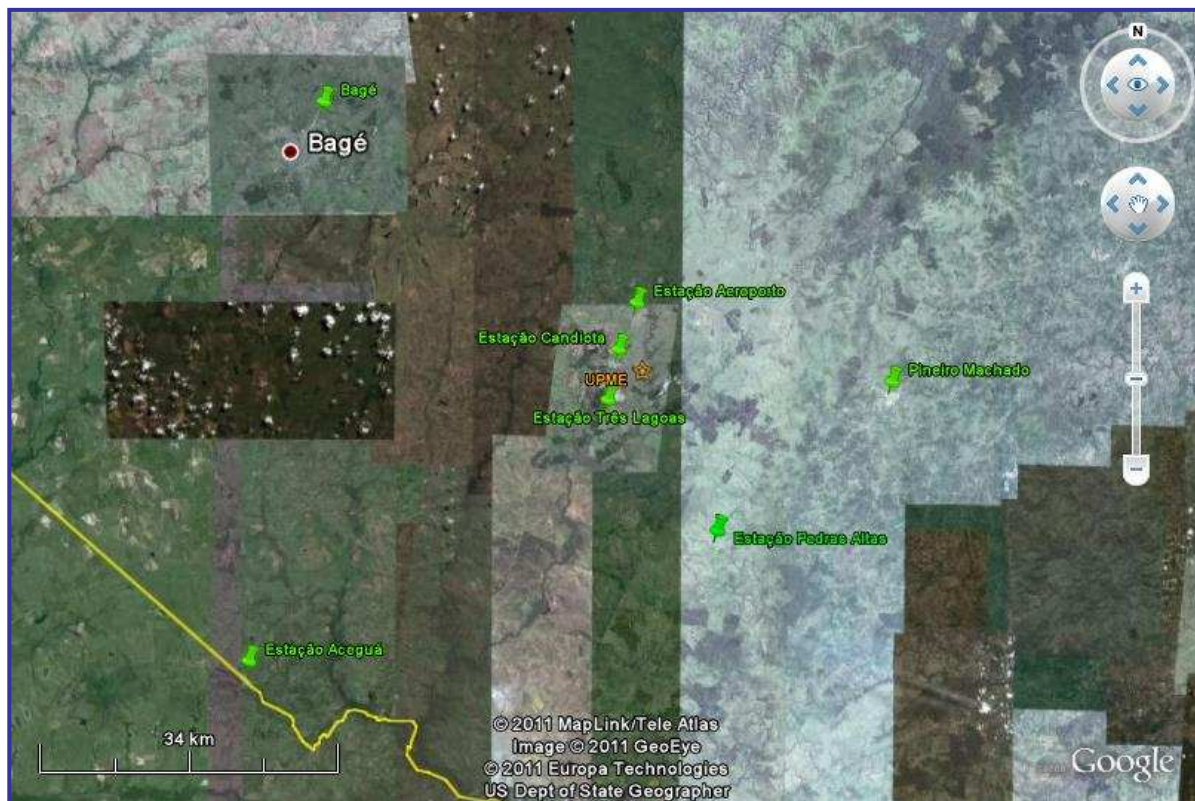
Figura 1 – Imagem de Satélite da localização das Estações de Monitoramento após a ampliação.

A Figura 1 apresenta a visualização por imagem de satélite da distribuição das estações o monitoramento na Rede de Monitoramento após a modernização e ampliação.