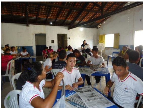
Foto 3-26 Participantes executando o primeiro passo da atividade: confecção dos rolinhos de jornal.