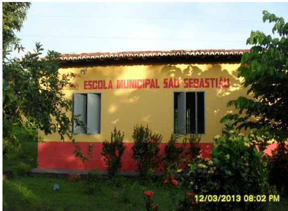
Foto 3-114 Frente da Escola Municipal São Sebastião, onde foi realizada a atividade.