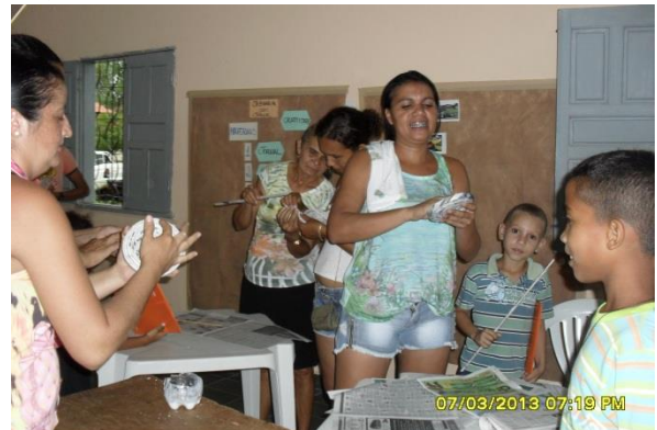
Foto 3-105 Etapa de finalização do caracol para a