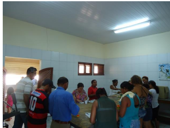
Foto 3-9 Todo o grupo ao redor na mesa.