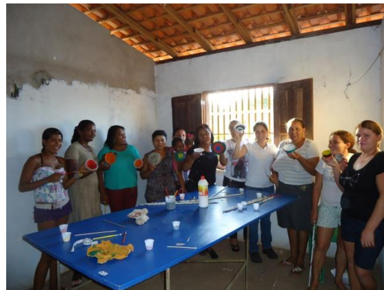
Foto 3-25 Equipe reunida ao final. Cada um com o seu produto em mãos.