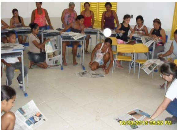
Foto 3-134 Explicação da primeira etapa: confecção dos canudos de jornal.