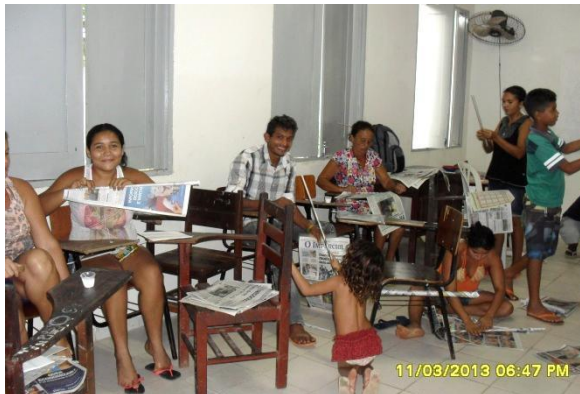
Foto 3-110 Participantes confeccionando os canudos de jornal.