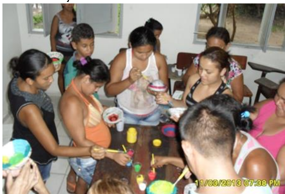
Foto 3-112 Momento da pintura dos artesanatos.