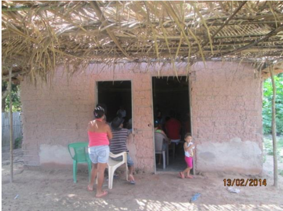
Foto 3-72 Local da atividade - Igreja Comunitária de La Bote.