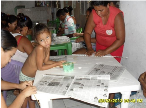
Foto 3-92 Moradores participantes atuando na confecção dos canudos de jornal.