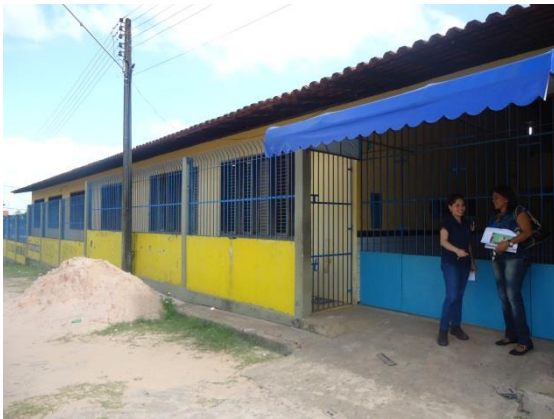
Foto 3-32 Local de realização da atividade – Centro de Ensino Vila Maranhão, São Luís/MA.