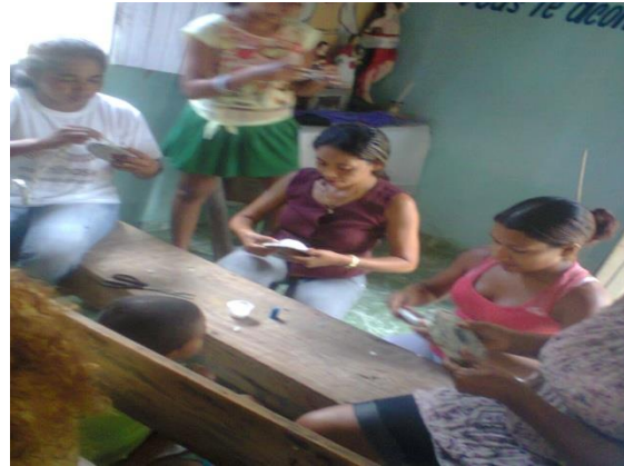
Foto 3-81 Montagem das cestas.