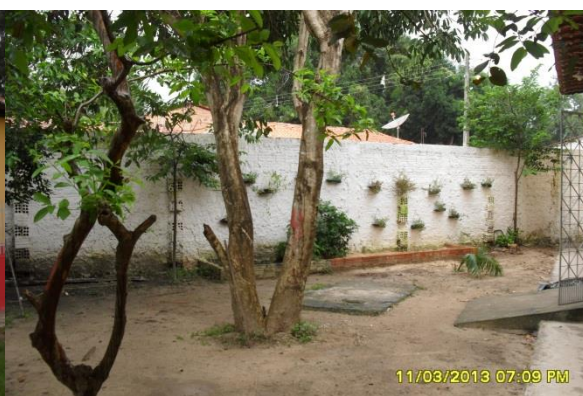
Foto 3-109 Exemplo de horta suspensa feita na escola com garrafas PET.