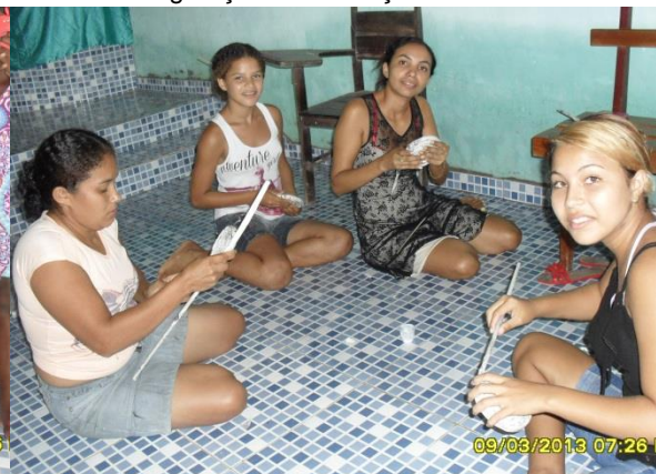
Foto 3-99 Moradoras produzindo suas cestas de jornal.