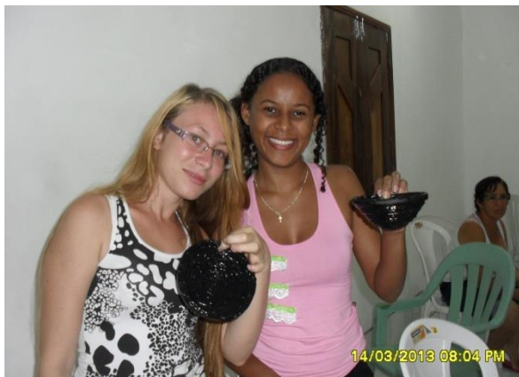
Foto 3-124 Professoras presentes exibindo suas cestas.