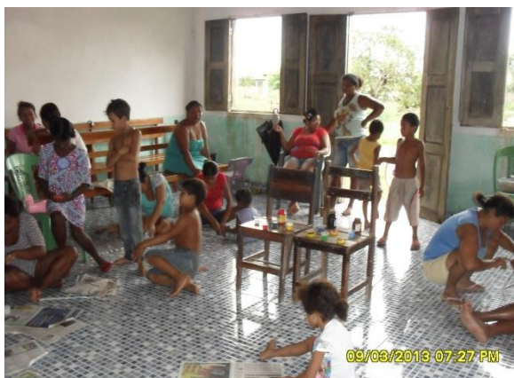
Foto 3-100 Visão geral.