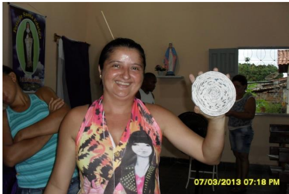
Foto 3-106 Moradora exibindo seu caracol finalizado.