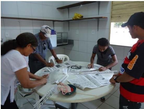
Foto 3-8 Participantes produzindo os rolinhos de jornal.