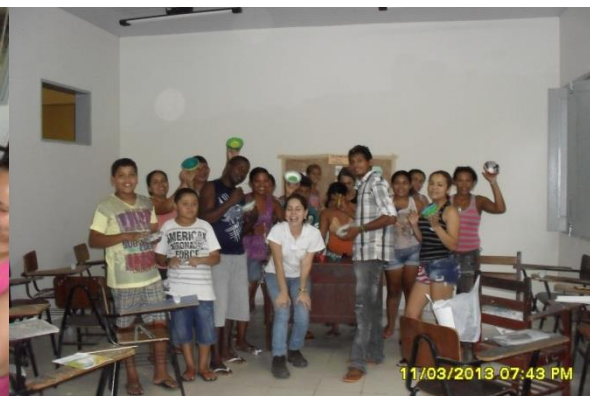
Foto 3-113 Todos reunidos ao final.