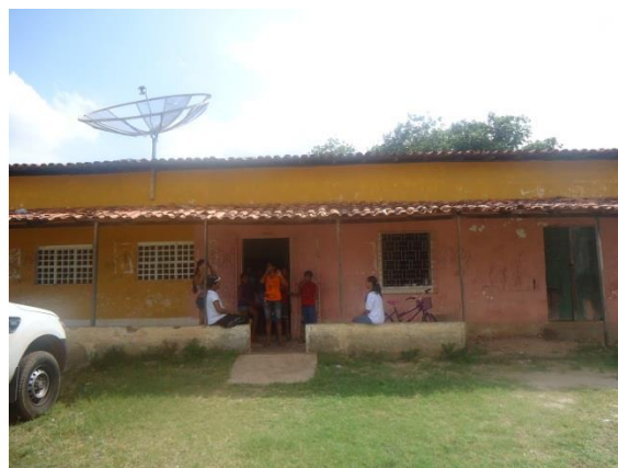
Foto 3-13 Local onde seria realizada a atividade e público presente.