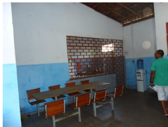
Foto 3-2 Mobilização e agendamento da palestra PSI e oficina PEA, em Pedrinhas.