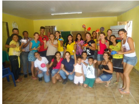
Foto 3-63 Todos participantes reunidos ao final da atividade.