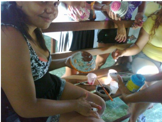
Foto 3-82 Pintura das cestas.