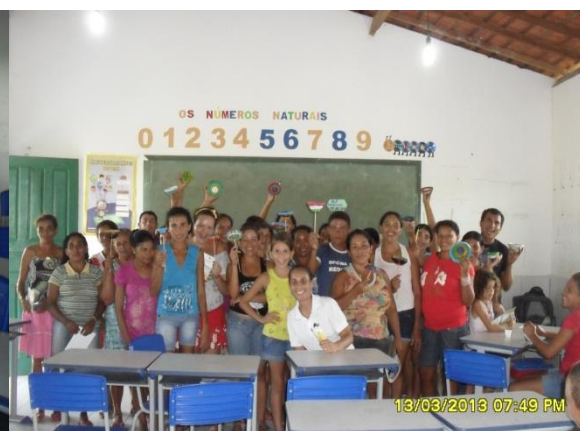
Foto 3-131 Comunidade reunida ao final com suas cestas em mãos.