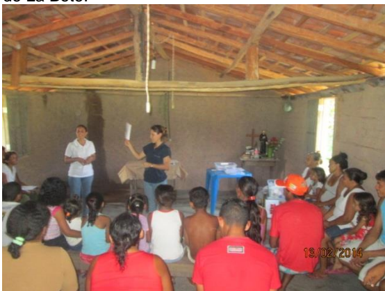
Foto 3-74 Diálogo inicial sobre educação ambiental, sobre o PEA e a questão dos resíduos.