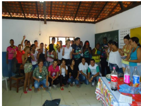
Foto 3-31 Público reunido ao final. Todos com os produtos em mãos.