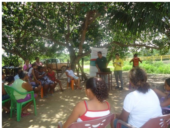
Foto 3-53 Reunião do Comitê de Interlocução que antecedeu a oficina.