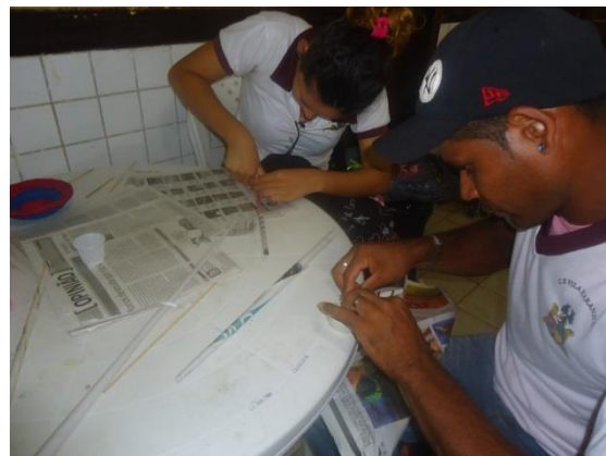
Foto 3-35 Produção da etapa do caracol, com o jornal.