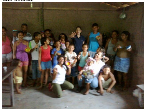
Foto 3-77 Todos participantes reunidos ao final da atividade.