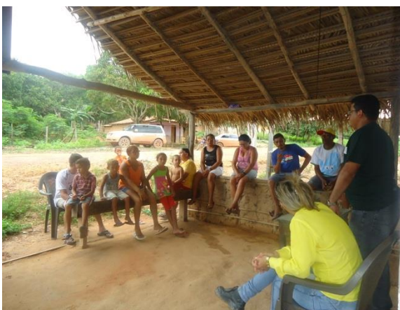
Foto 3-64 Moradores de Presinha presentes durante a reunião do Comitê de Interlocução.

Visando um maior aproveitamento da comunidade diante das ações do PEA, então, de uma fidedigna implantação do programa, diante do que se propõem no PBA, julgou-se por melhor cancelar a ação naquele momento, diante dos presentes e como acordo deles, prevendo-se um reagendamento em momento mais oportuno a ser validado.