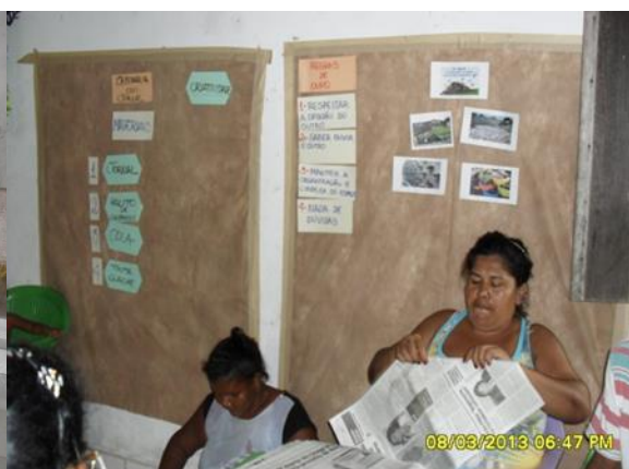
Foto 3-91 Mural ao fundo com citações sobre o lixo anexadas.