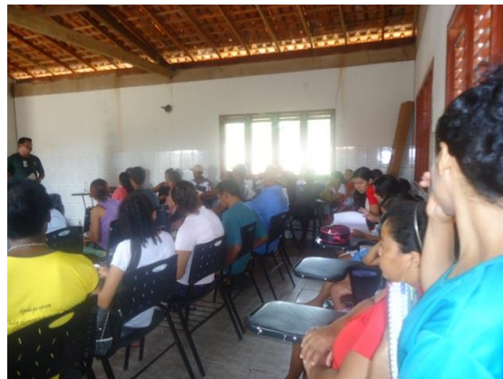
Foto 3-47 Público presente.