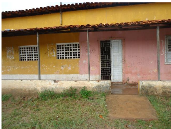
Foto 3-12 Local onde seria realizada a atividade – Centro Comunitário de Coqueiro, São Luís/MA.