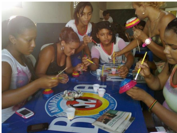
Foto 3-30 Grupo de mulheres na etapa final de produção das cestas, a pintura.