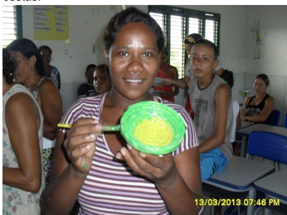
Foto 3-130 Participante exibindo sua cesta acabada.