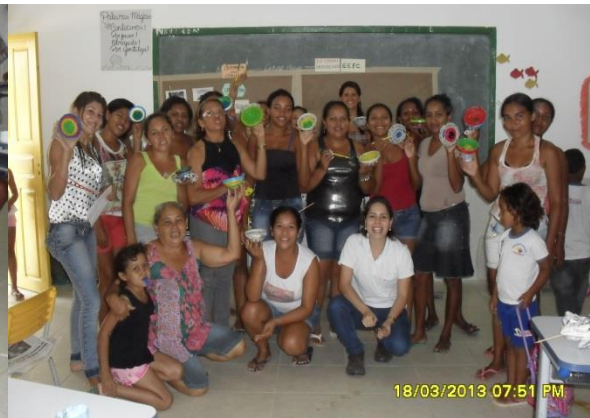
Foto 3-137 Comunidade reunida ao final com suas cestas em mãos.

Todas as listas de presença das oficinas realizadas encontram-se no Anexo IV deste relatório.