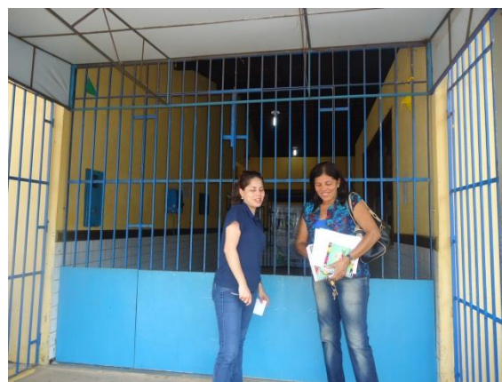
Foto 3-3 Mobilização e agendamento da palestra PSI e oficina PEA, em Pedrinhas.