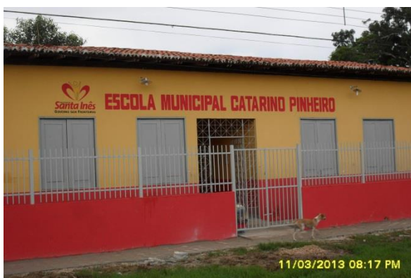
Foto 3-108 Frente da Escola Municipal Catarino Pinheiro.