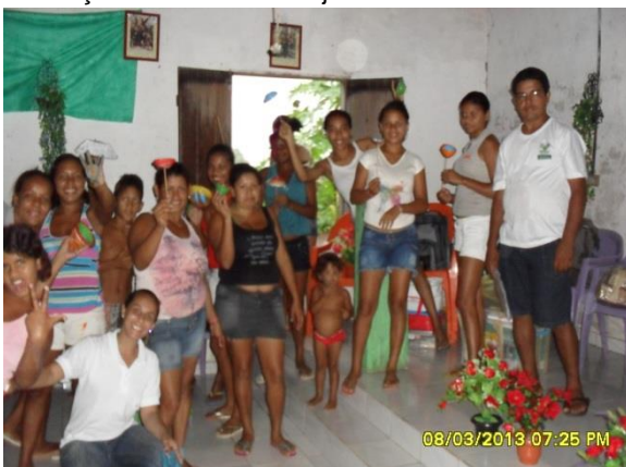
Foto 3-94 Todos reunidos ao final exibindo os materiais prontos.