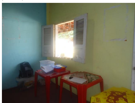
Foto 3-41 Espaço onde seria realizada a atividade.