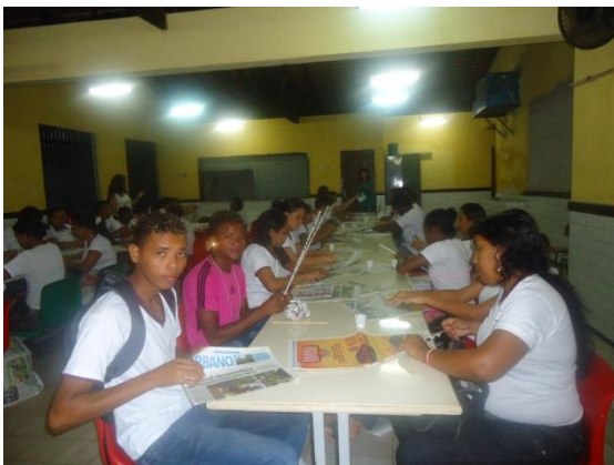
Foto 3-34 Participantes produzindo os rolinhos de jornal.