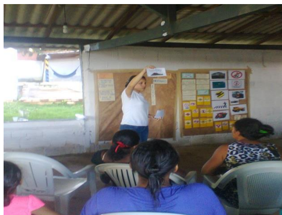
Foto 3-85 Abordagem inicial sobre os resíduos sólidos.