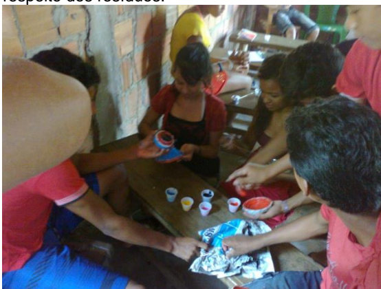
Foto 3-70 Pintura das cestas confeccionadas.