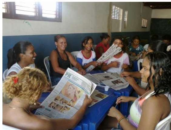
Foto 3-27 Participantes executando o primeiro passo da atividade: confecção dos rolinhos de jornal.