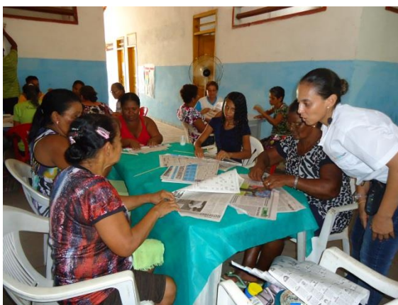
Foto 3-13 Produção das cestas pelo público participante.