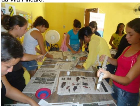
Foto 3-60 Confecção dos canudos de jornal.