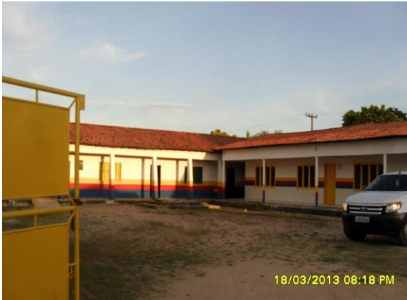
Foto 3-132 Escola onde aconteceu a atividade.