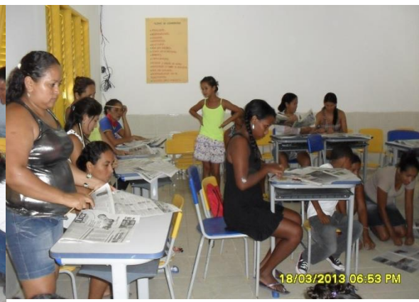
Foto 3-135 Participantes confeccionando as cestas.