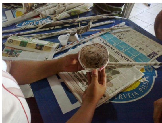
Foto 3-11 Exemplo de cesta produzida na oficina.