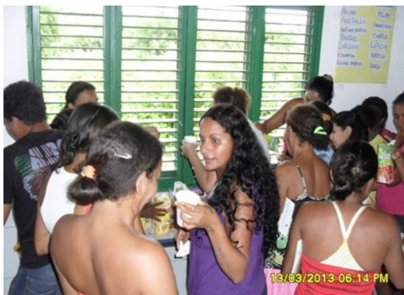
Foto 3-126 Momento do lanche que antecedeu a