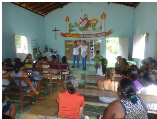
Foto 3-79 Abordagem inicial sobre os resíduos sólidos e o PEA.