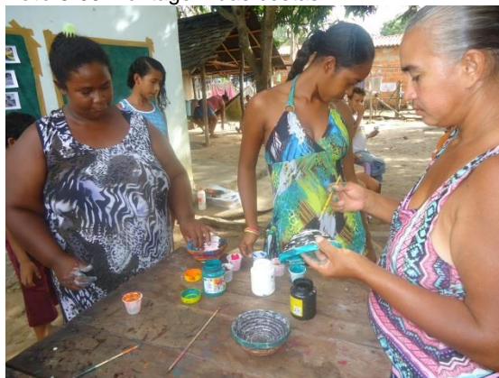
Foto 3-57 Acabamento da cestaria com a pintura.