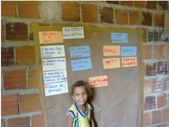
Foto 3-68 Mural exposto, com “regras de ouro” e palavras-chave sobre a questão discutida a respeito dos resíduos.