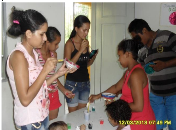
Foto 3-118 Momento da pintura.