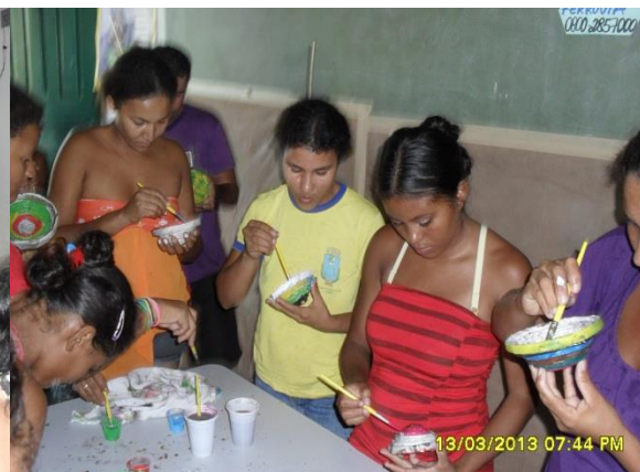
Foto 3-129 Momento da pintura.