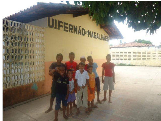
Foto 3-43 Crianças presentes no local.