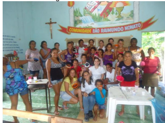
Foto 3-83 Todos participantes reunidos ao final da atividade.