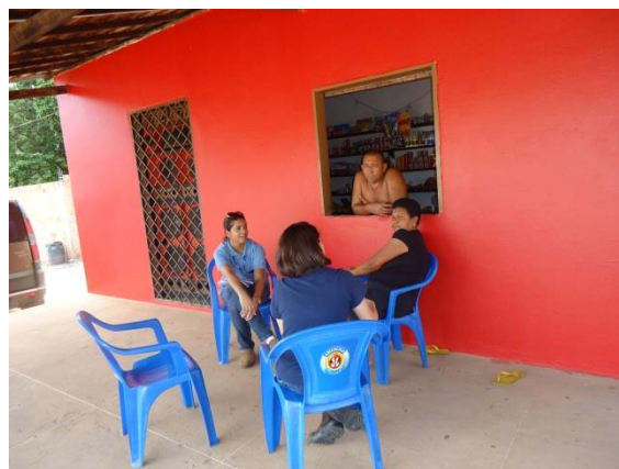
Foto 3-7 Mobilização e agendamento da palestra PSI, e oficina PEA, em Vila Jussara.

A ata da reunião citada acima consta no Anexo II deste relatório.