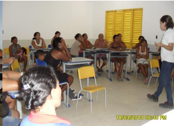
Foto 3-133 Abordagem inicial sobre a questão do lixo.