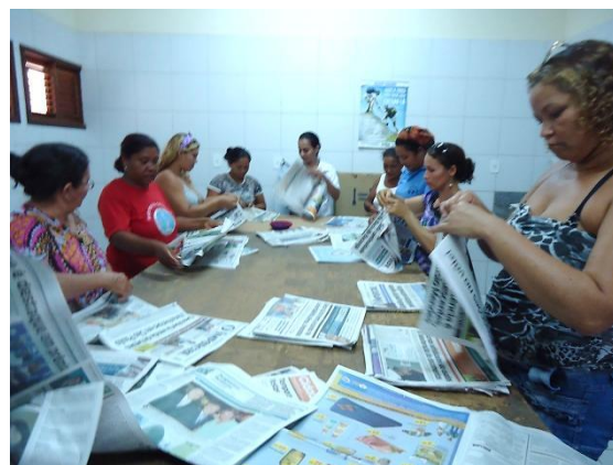
Foto 3-17 Participantes iniciando o processo de confecção das cestas, após diálogo sobre reaproveitamento de resíduos.