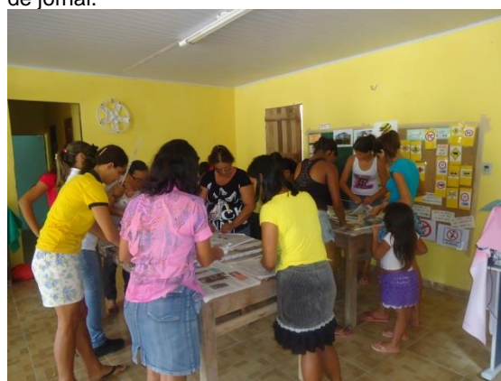
Foto 3-61 Montagem das cestas.