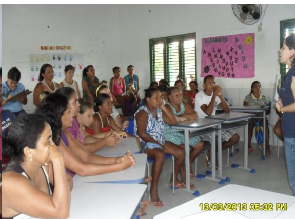
Foto 3-127 Abordagem inicial sobre a questão do