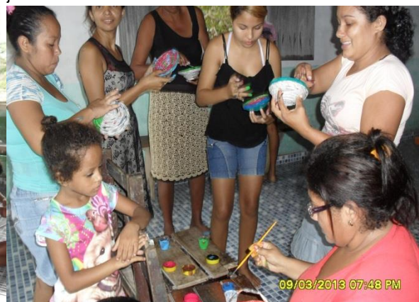
Foto 3-101 Participantes, no final da oficina, pintando a cestaria com tintas coloridas.