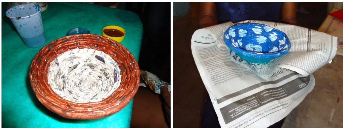
Foto 3-9 Exemplo de cestaria (artesanato) produzido nas oficinas do PEA, com a utilização do jornal.

Entre novembro e dezembro de 2013 foram realizadas cinco (05) oficinas de artesanato na Locação 02, com um público total de 147 pessoas . Ressalta-se que duas (02) oficinas foram canceladas por ausência do público esperado.