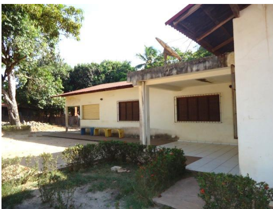
Foto 3-16 Local de realização da atividade – Centro Comunitário Assentamento de Rio Grande, em Rio Grande (São Luís – MA).