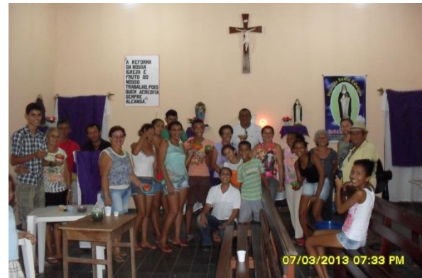
Foto 3-107 Todos os participantes reunidos ao final segurando suas cestas prontas.