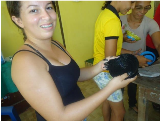
Foto 3-62 Moradora participante exibindo sua cesta finalizada.