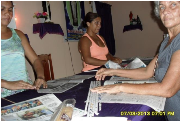
Foto 3-104 Participantes confeccionando os canudos