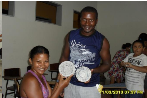
Foto 3-111 Casal exibindo artesanato feito.