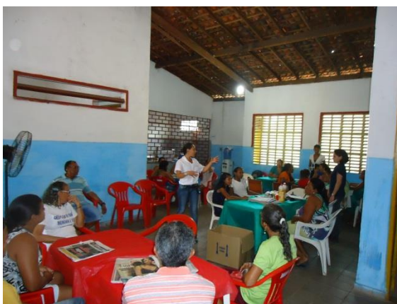
Foto 3-11 Diálogo sobre educação ambiental e geração de resíduos.