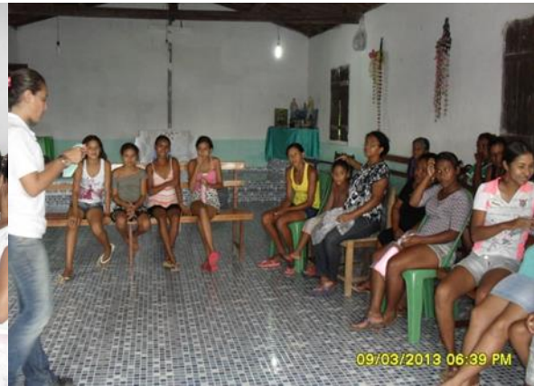
Foto 3-97 Abordagem inicial sobre questões ambientais e geração e destinação de lixo.