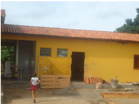
Foto 3-46 Escola onde foi realizada a atividade.