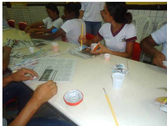
Foto 3-37 Momento da pintura da cestaria para finalização.