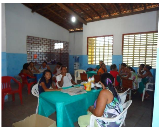
Foto 3-10 Participantes chegando ao local e se acomodando nas mesas.