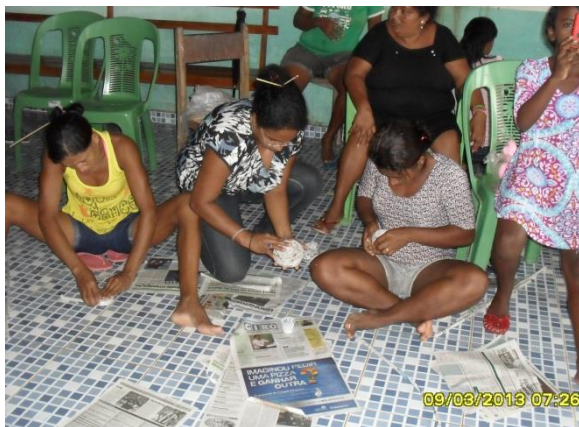
Foto 3-98 Moradoras produzindo suas cestas.