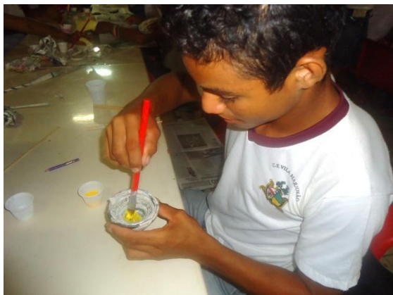
Foto 3-36 Momento da pintura da cestaria.