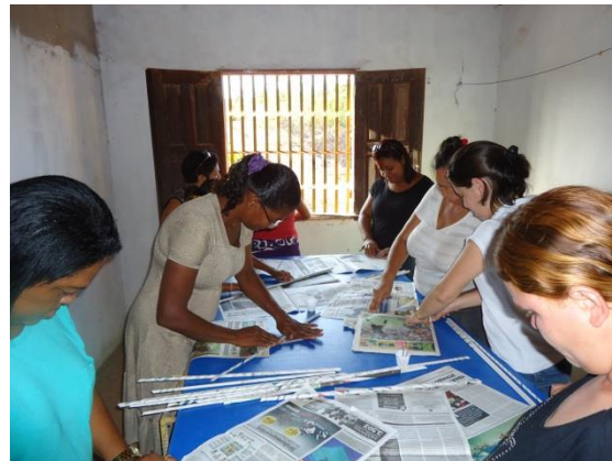
Foto 3-23 Participantes iniciando o processo de confecção das cestas, após diálogo sobre reaproveitamento de resíduos.