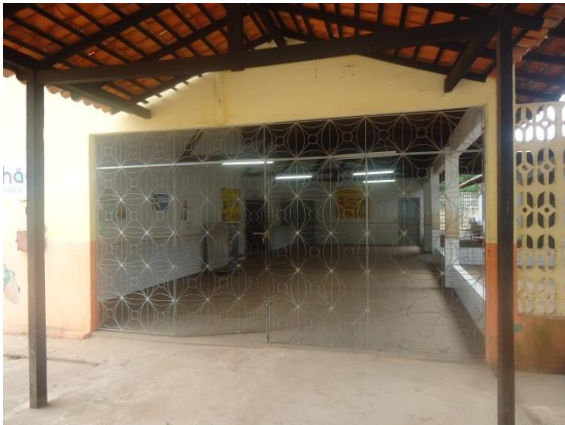
Foto 3-42 Local onde seria realizada a atividade – Unidade Integrada Fernão de Magalhães, São Luís/MA.