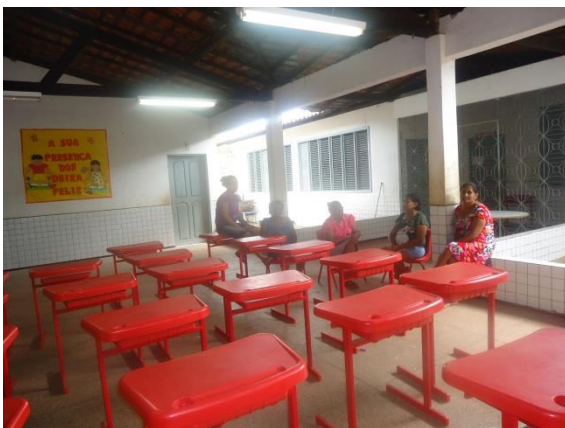
Foto 3-44 Espaço onde seria realizada a atividade e o pouco público presente.