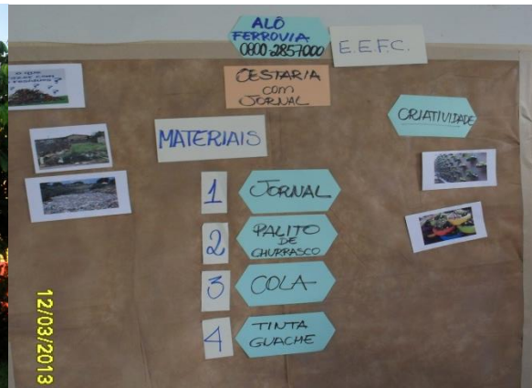
Foto 3-115 Mural afixado com palavras e imagens utilizadas durante a atividade.