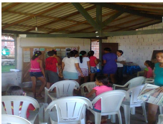
Foto 3-86 Distribuição das folhas de jornal.