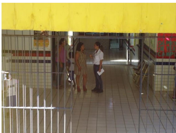
Foto 3-3 Mobilização e agendamento Blitz na U.E.B. Evandro Bessa, em Estiva.