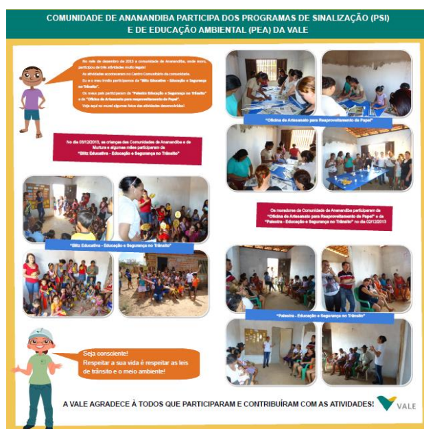
Foto 3-138 – Exemplo de banner elaborado para as comunidades de Ananandiba e Pedrinhas.

No mês de janeiro foram elaborados banners ilustrativos para as atividades realizadas em novembro e dezembro de 2013 nas seguintes comunidades: Ananandiba, Estiva, Pedrinhas, Rio Grande e Vila Maranhão. A ideia é que estes banners fiquem expostos nos Centros Comunitários de cada comunidade, a fim de atingir um número significativo de moradores.