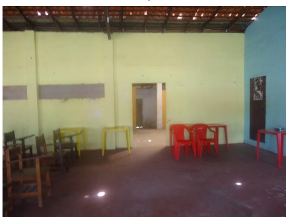
Foto 3-40 Espaço onde seria realizada a atividade.