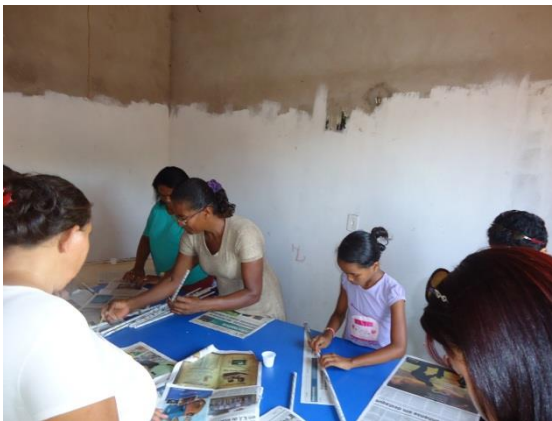
Foto 3-24 Participantes produzindo os rolinhos de jornal.