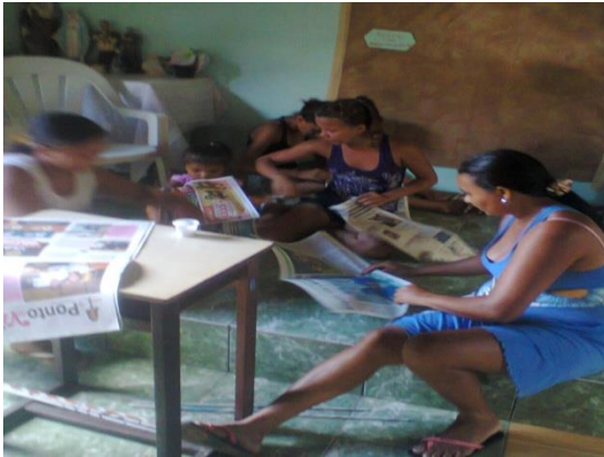
Foto 3-80 Confeção dos canudos de jornal.