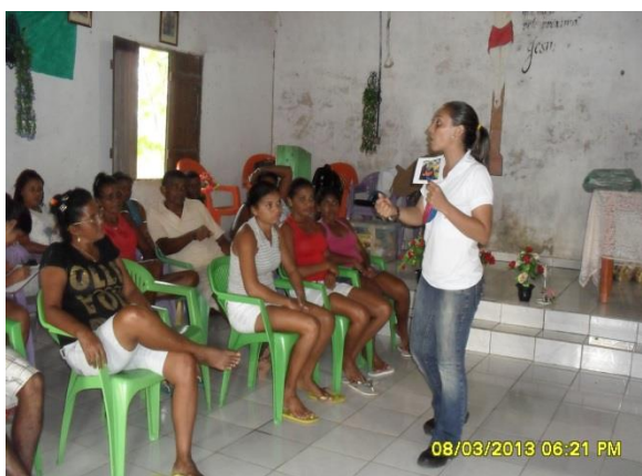
Foto 3-90 Abordagem inicial sobre a questão dos resíduos.