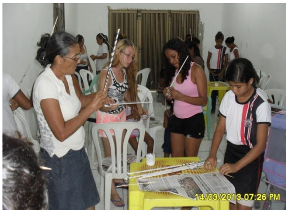
Foto 3-122 Montagem das cestas.