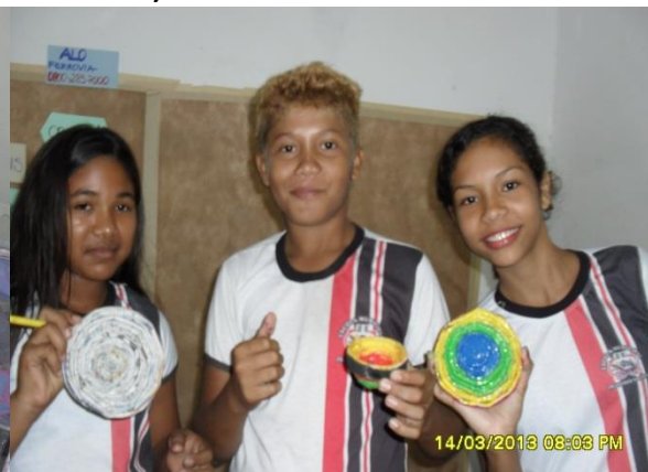
Foto 3-123 Participantes exibindo suas cestas prontas.