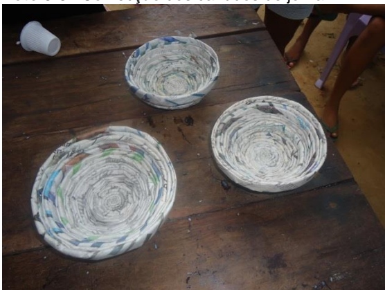
Foto 3-56 Cestas confeccionadas pelas moradoras de Vila Concórdia.