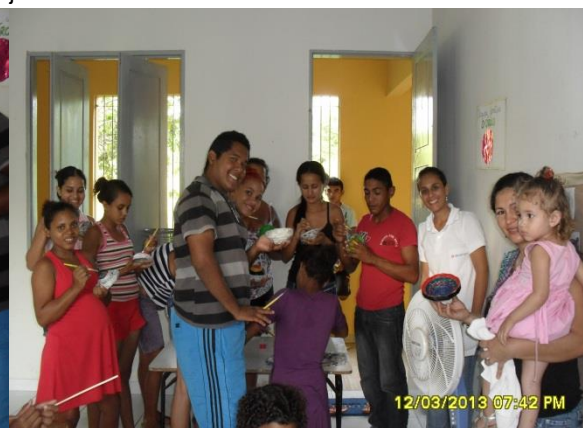
Foto 3-119 Todos ao final exibindo o produto feito.