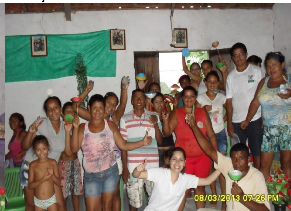
Foto 3-95 Todos reunidos ao final exibindo os materiais prontos.