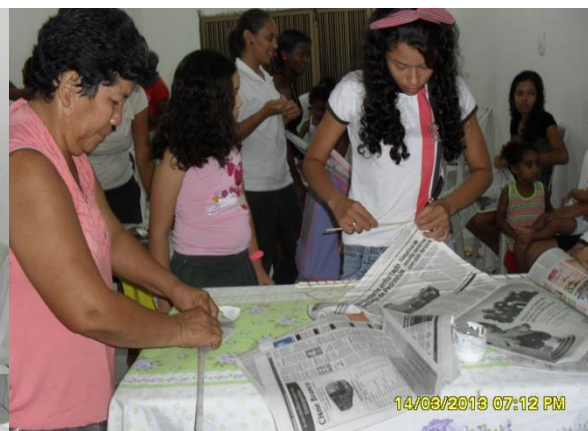
Foto 3-121 Participantes confeccionando os canudos de jornal.