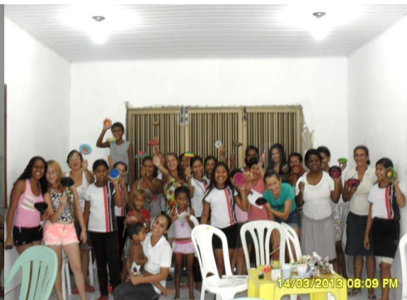
Foto 3-125 Todos os presentes da comunidade reunidos ao final.