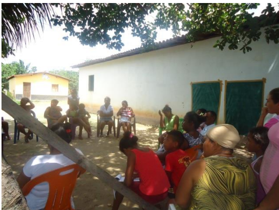
Foto 3-52 Local da atividade e público presente.