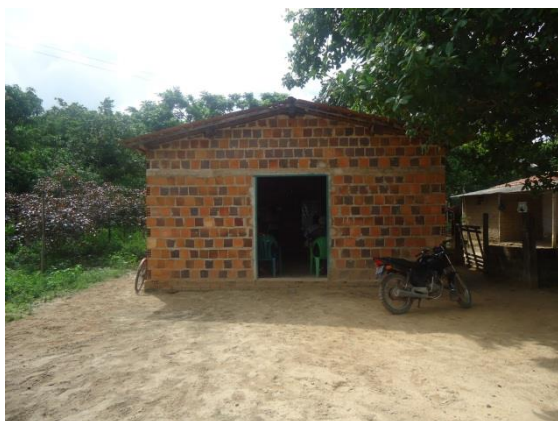
Foto 3-66 Local da atividade - Sede do Sindicato dos Trabalhadores Rurais da Vila dos Farias.