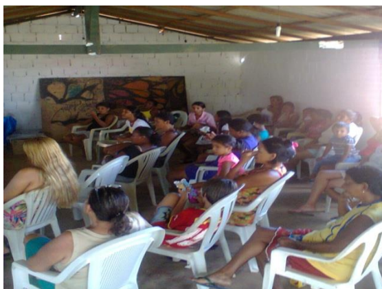
Foto 3-84 Público presente.