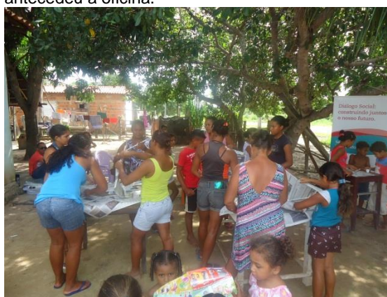
Foto 3-55 Montagem das cestas.