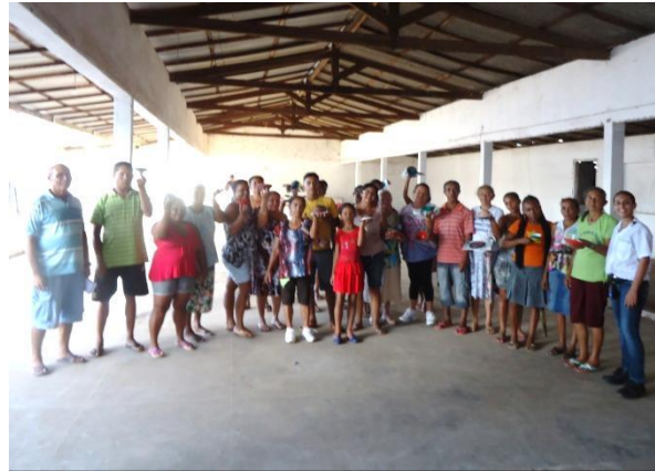
Foto 3-15 Público reunido ao final. Todos com os produtos em mãos.