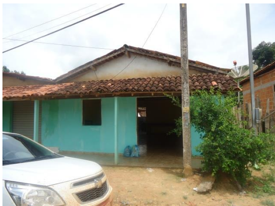
Foto 3-58 Local da atividade - Sede da Associação da Vila Pindaré.