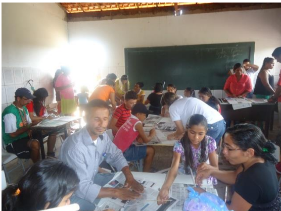
Foto 3-48 Confeção das cestas de jornal.