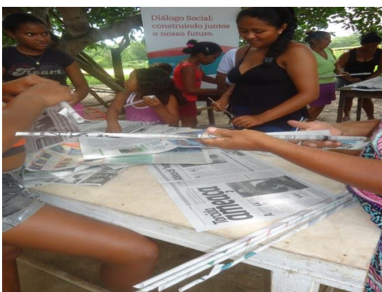
Foto 3-54 Confeção dos canudos de jornal.