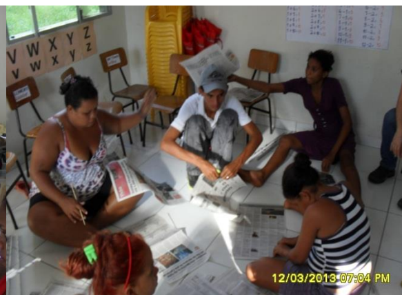
Foto 3-117 Moradores produzindo as cestas de jornal.