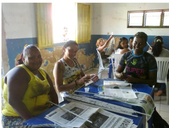
Foto 3-10 Participantes executando o primeiro passo da atividade: confecção dos rolinhos de jornal.