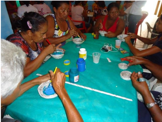
Foto 3-14 Produção das cestas pelo público participante, etapa de pintura.