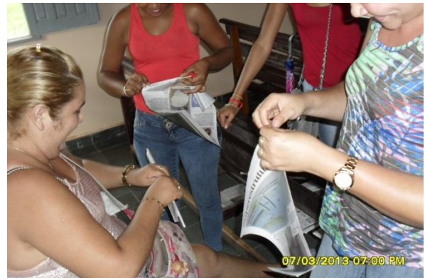
Foto 3-103 Participantes confeccionando os canudos de jornal.