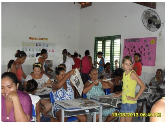
Foto 3-128 Todos os presentes produzindo as cestas.