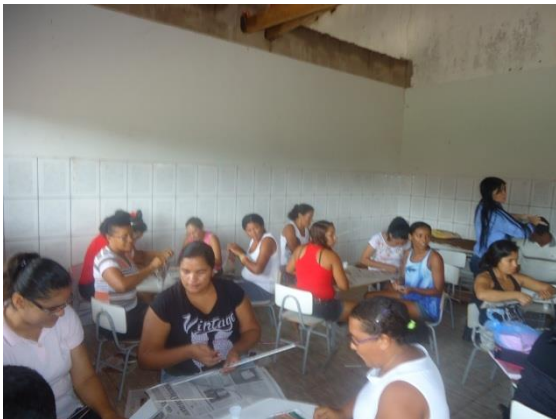
Foto 3-50 Confeção das cestas de jornal.