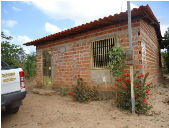
Foto 3-22 Local de realização da atividade – Centro Comunitário de Ananandiba, São Luís/MA.