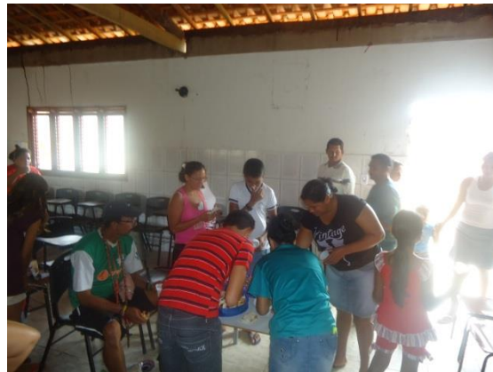
Foto 3-51 Momento do lanche.