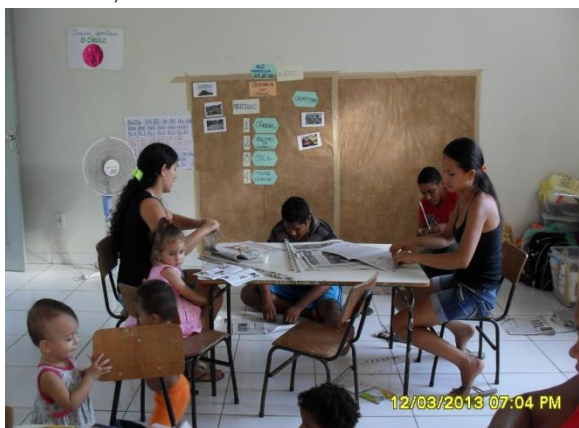
Foto 3-116 Moradores produzindo as cestas de jornal.