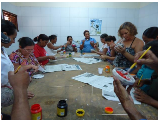
Foto 3-20 Momento da pintura da cestaria.