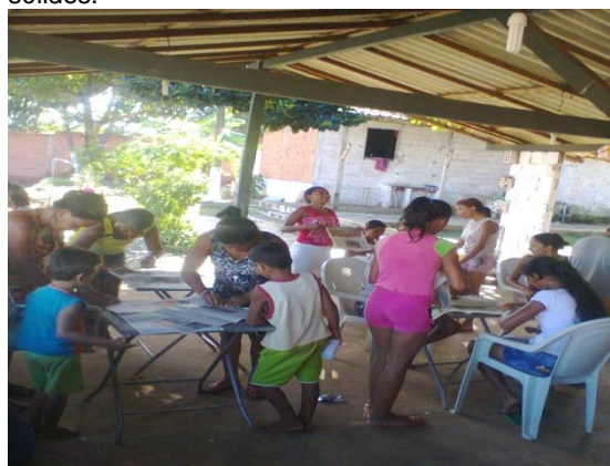
Foto 3-87 Montagem das cestas.