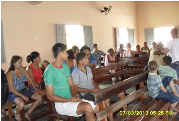
Foto 3-102 Abordagem inicial sobre a questão dos resíduos.