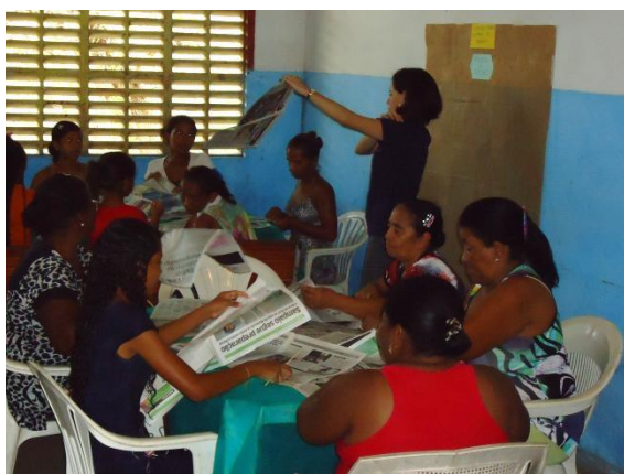
Foto 3-12 Explicação passo-a-passo para a confecção das cestas.