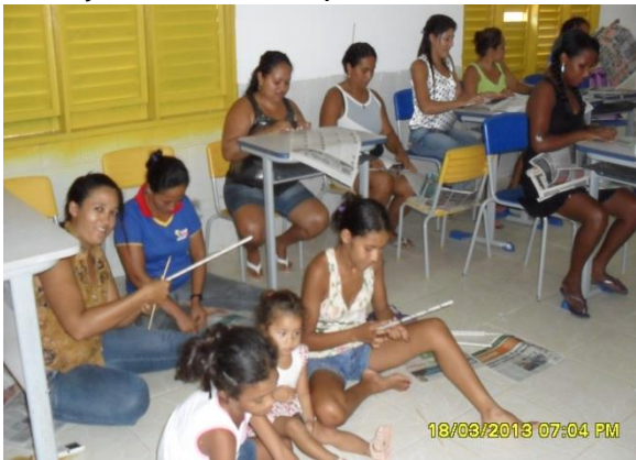
Foto 3-136 Participantes confeccionando as cestas.