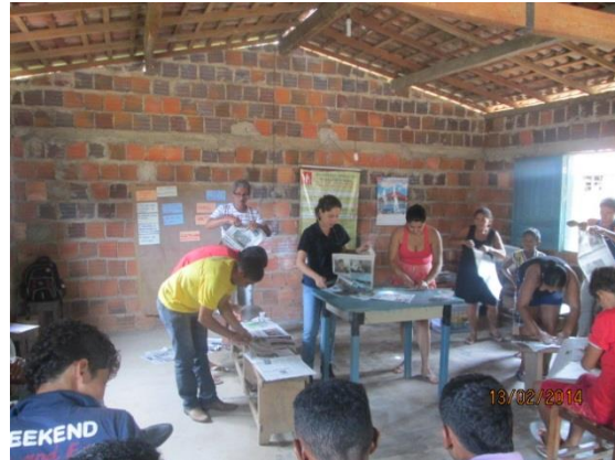
Foto 3-69 Distribuição do jornal e início da montagem das cestas.