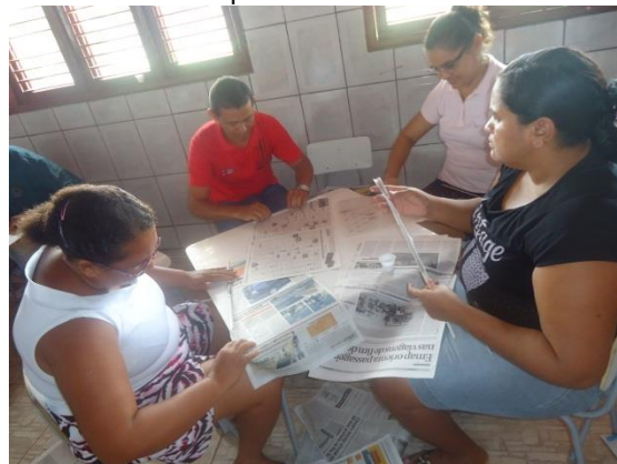
Foto 3-149 Confeção das cestas de jornal.