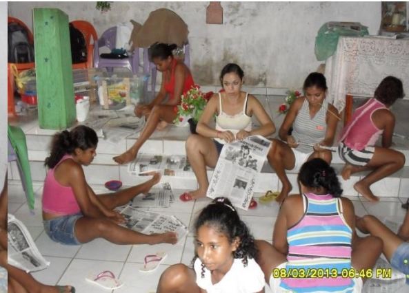
Foto 3-93 Comunidade trabalhando reunida na confecção das cestas.