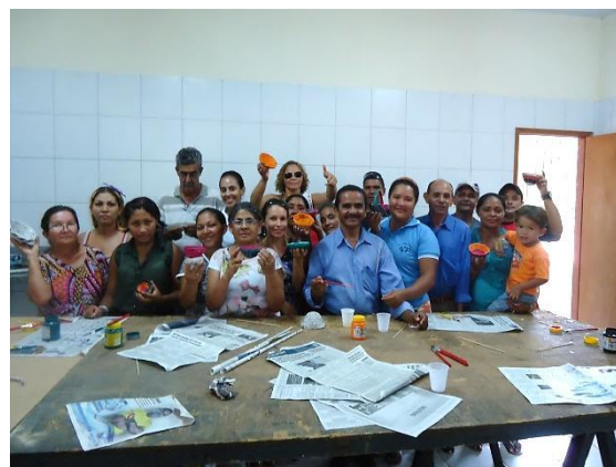
Foto 3-21 Equipe reunida ao final. Cada um com o seu produto em mãos.