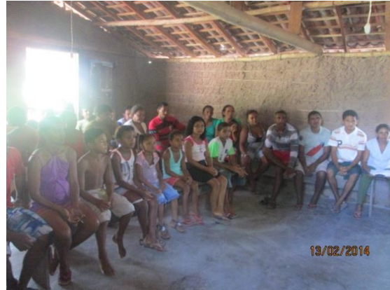
Foto 3-73 Público presente.