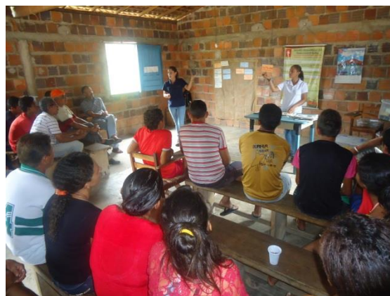
Foto 3-67 Abordagem inicial sobre as ações ambientais da obra, educação ambiental e questões relacionadas ao gerenciamento do lixo na comunidade.