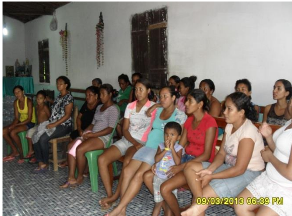
Foto 3-96 Público presente.