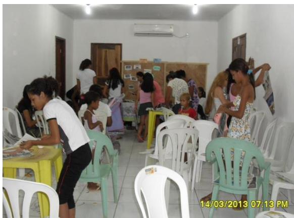
Foto 3-120 Visão geral durante a oficina.