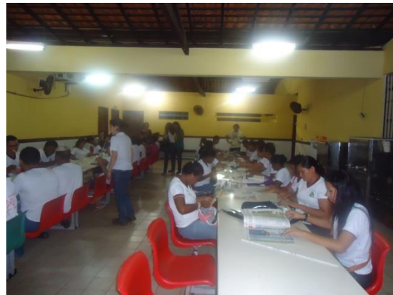
Foto 3-33 Alunos dispostos nas mesas do refeitório da escola, para a realização da oficina.