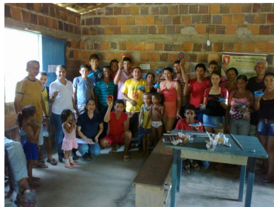
Foto 3-71 Todos participantes reunidos ao final da atividade.