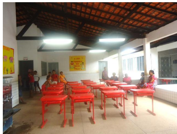
Foto 3-45 Espaço onde seria realizada a atividade e o pouco público presente.