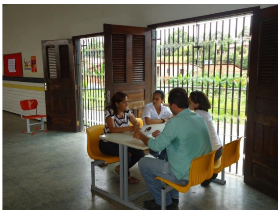
Foto 3-1 Mobilização e agendamento Blitz na U.E.B. Evandro Bessa, em Estiva.