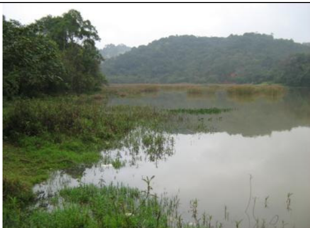
Foto 15: Estação de coleta 05 - Represa Tanque Grande - Ribeirão Tanque Grande.