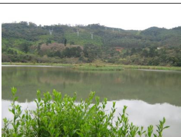
Fotos 05 e 06: Estação de coleta 2, Corpo da Represa de Mariporã – Rio Juqueri.