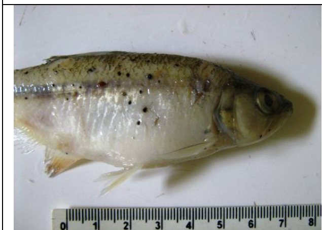
Foto 27: Exemplo de Oligosarcus paranensis infestado por fungos (bolinhas pretas).