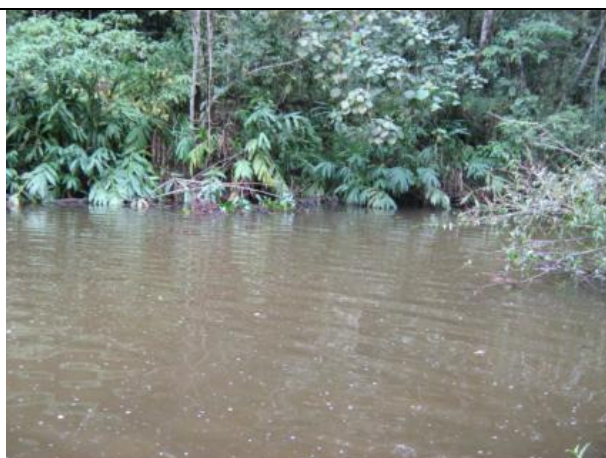
Fotos 11 e 12: Estação de coleta 04 - Trecho a jusante da Represa do Cabuçu - Ribeirão Cabuçu.