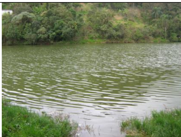
Fotos 01 e 02: Estação de coleta 01 - Braço na Margem Esquerda da Represa Mairiporã – Rio Juqueri.