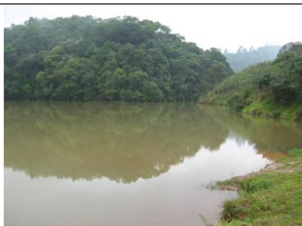
Fotos 13 e 14: Estação de coleta 05 - Represa Tanque Grande - Ribeirão Tanque Grande.