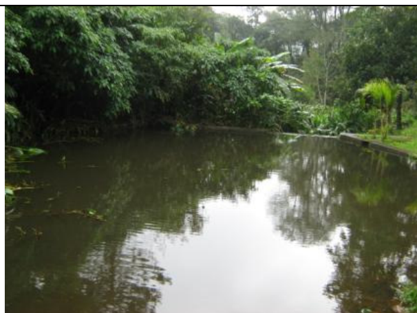
Fotos 07 e 08: Estação de coleta 03 - Trecho a jusante da Represa do Engordador - Ribeirão Engordador.