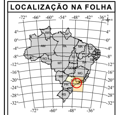
Figura 3.3.3.1.b: MACRO DIRETRIZES DE TRAÇADO