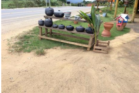
Data da Foto: 15/04/14 - Direção: 254,5 - Latitude: -20,0275031430833 - Longitude: -40,3979525249828