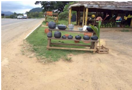
Data da Foto: 15/04/14 - Direção: 303,0 - Latitude: -20,0275205355324 - Longitude: -40,3979588114101