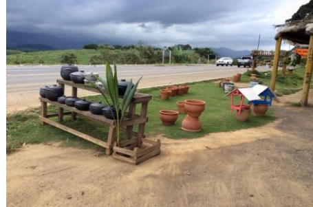
Data da Foto: 15/04/14 - Direção 229,1 - Latitude -20,027516763676 - Longitude -40,3979484178502