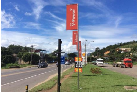
Data da Foto: 31/03/14 - Direção: 61,7 - Latitude: -19,8232759349233 - Longitude: -40,3699959442395