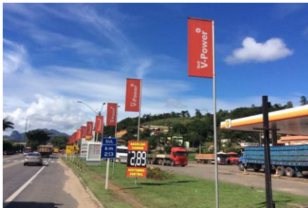
Data da Foto: 31/03/14 - Direção: 109,4 - Latitude: -19,8232664214632 - Longitude: -40,3699739836532