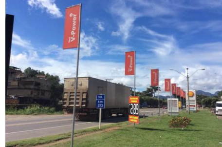
Data da Foto: 31/03/14 - Direção 45,3 - Latitude -19,8232958419433 - Longitude -40,3700268734622