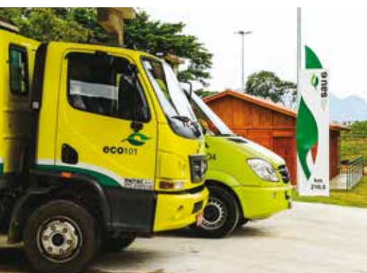
Novas bases SAU ao longo da BR-101/ES/BA