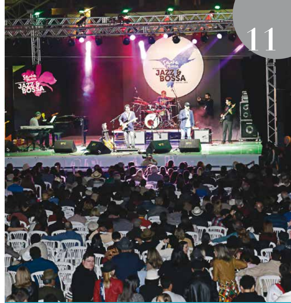
Imagens do festival Santa Teresa Jazz &amp; Bossa 2014.