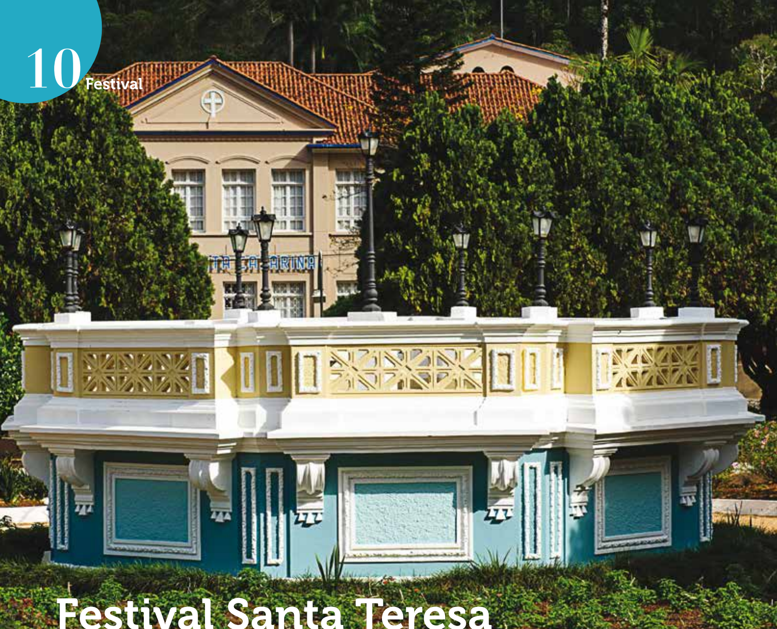
Praça no centro de Santa Teresa.