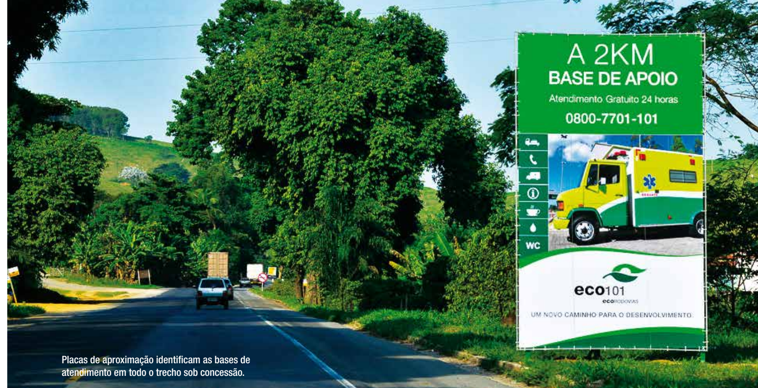
Placas de aproximação identificam as bases de atendimento em todo o trecho sob concessão.