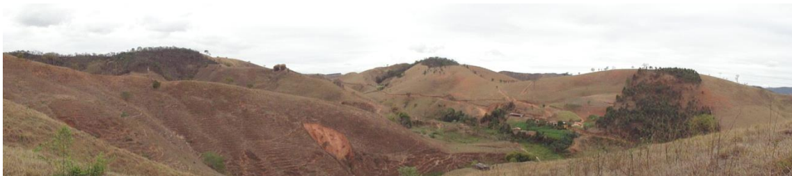
Panorâmica de região de pastagens, Levantamento Florístico e Fitossociológico da BR-262/MG, Outubro de 2014.