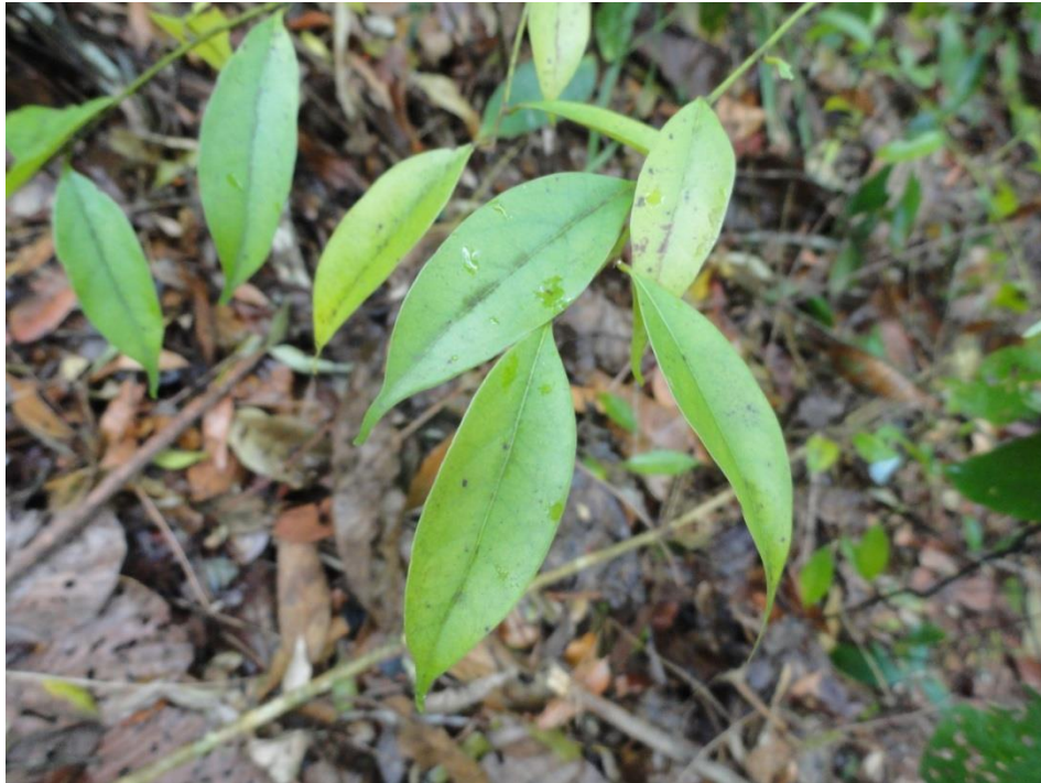
Ramo de Ocotea lancifolia em regeneração no sub-bosque, Levantamento Florístico e Fitossociológico da BR-262/MG, Outubro de 2014.