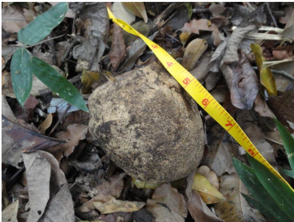
Fruto de Lecyhtis pisonis (sapucaia) em fragmento em estágio avançado, Levantamento Florístico e Fitosociológico da BR-262/MG, Outubro de 2014. (escala da trena em pol.)