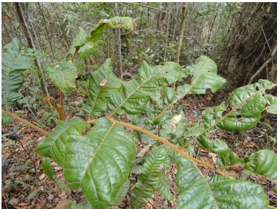
Plântula de Guarea macrophylla em regeneração em fragmento em estágio avançado, Levantamento Florístico e Fitosociológico da BR-262/MG, Outubro de 2014.