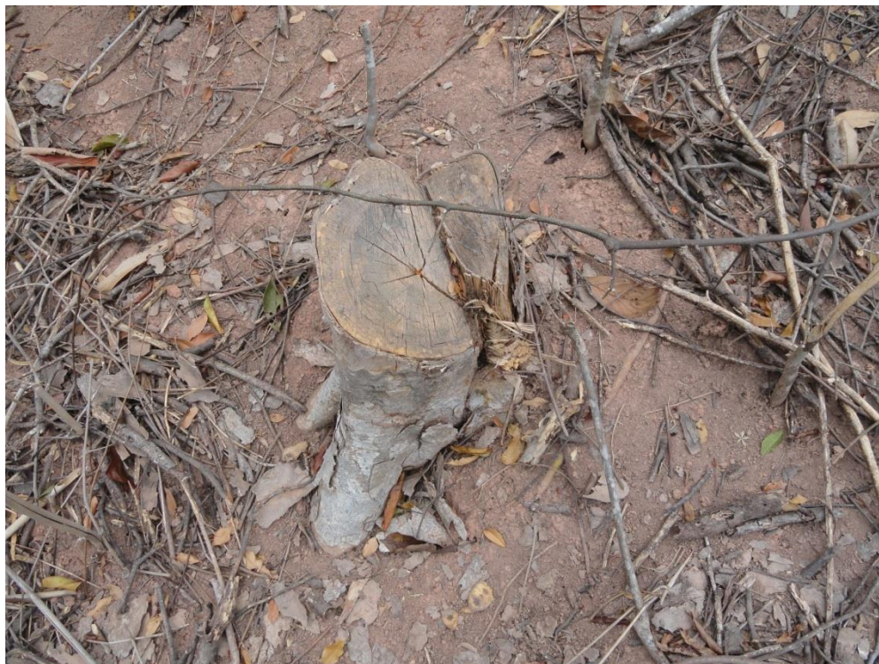
Árvore cortada no interior de fragmento em estágio avançado de regeneração atingido pelo fogo, Levantamento Florístico e Fitossociológico da BR-262/MG, Outubro de 2014.