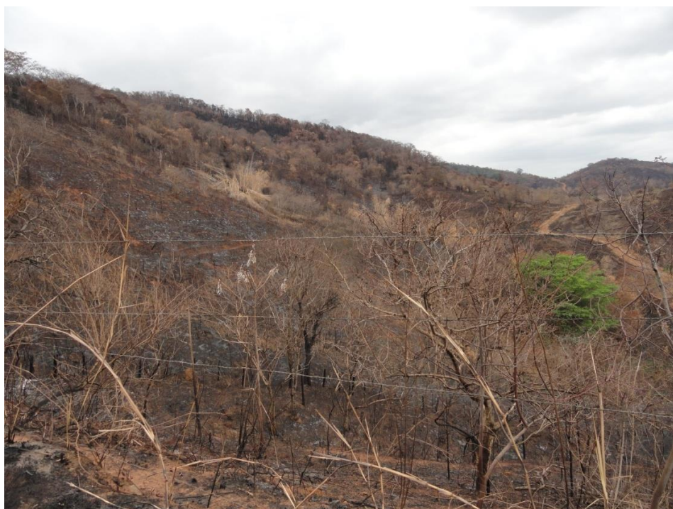
Área de pastagem com fragmentos florestais completamente queimados por ação do fogo, Levantamento Florístico e Fitossociológico da BR-262/MG, Outubro de 2014.