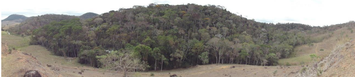
Panorâmica de região de pastagens com fragmento florestais, Levantamento Florístico e Fitossociológico da BR-262/MG, Outubro de 2014.