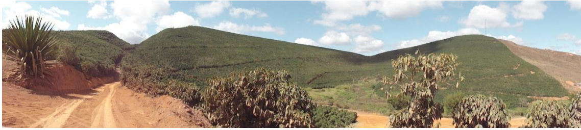
Panorâmica de região produtora de café, Levantamento Florístico e Fitossociológico da BR-262/MG, Outubro de 2014.