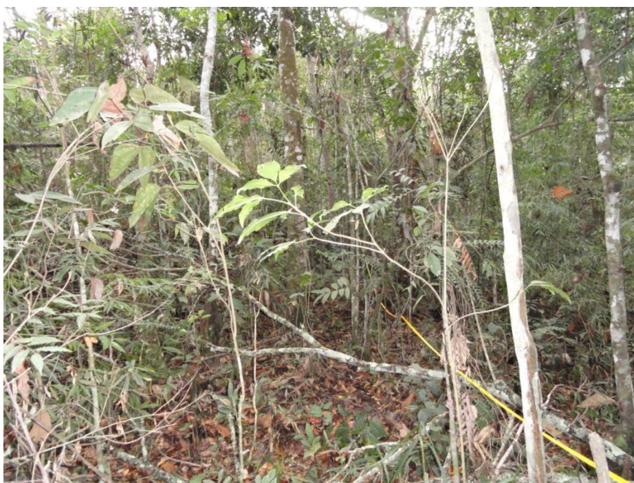
Aspecto geral do sub-bosque da Parcela 02 com destaque para a intensa regeneração natural, Levantamento Florístico e Fitossociológico da BR-262/MG, Outubro de 2014.