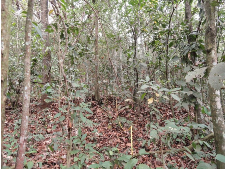
Aspecto geral do sub-bosque da Parcela 01 com destaque para a abundante serapilheira, Levantamento Florístico e Fitossociológico da BR-262/MG, Outubro de 2014.