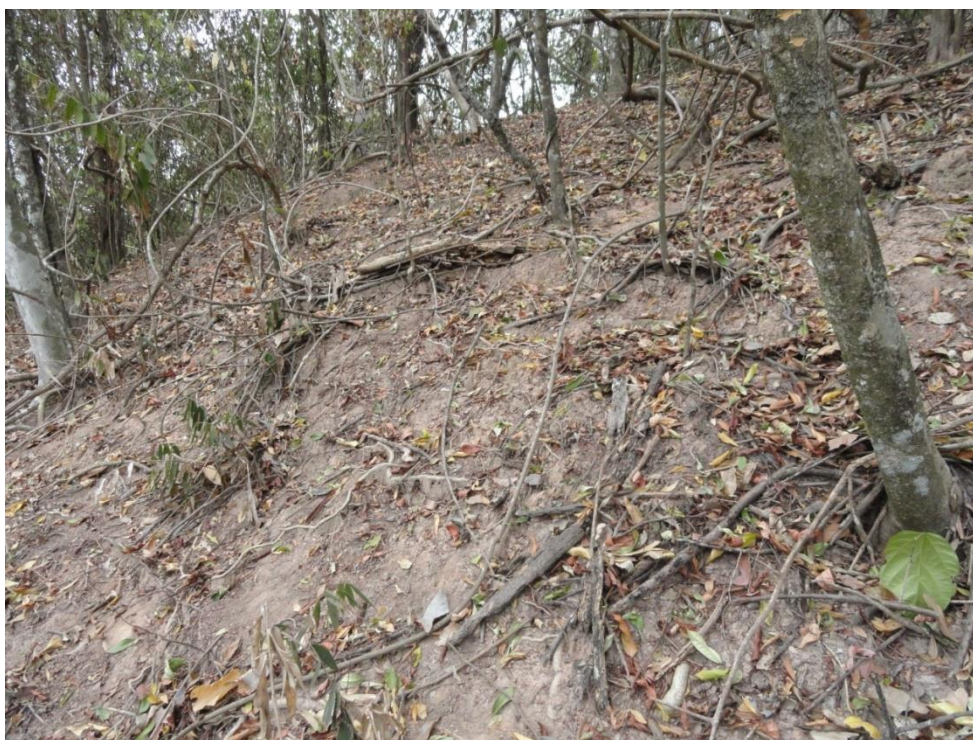
Aspecto do solo e da serapilheira de fragmento atingido pelo fogo, Levantamento Florístico e Fitossociológico da BR-262/MG, Outubro de 2014.