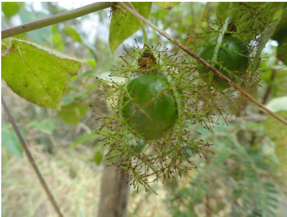
Fruto de Passiflora foetida , Levantamento Florístico e Fitossociológico da BR-262/MG, Outubro de 2014.