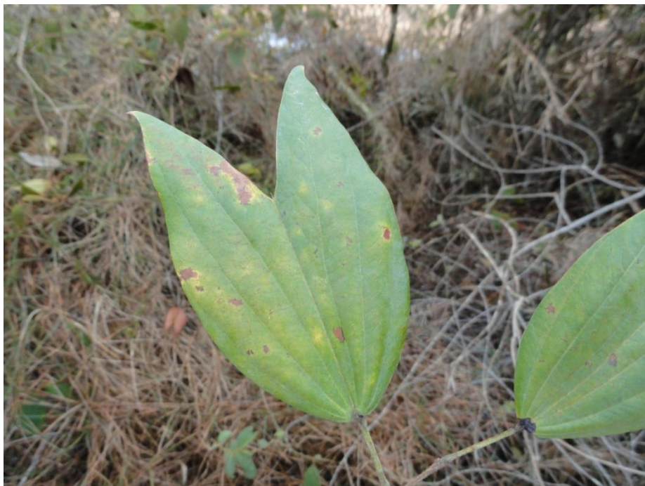
Folhas de Bauhinia sp. 01, Levantamento Florístico e Fitossociológico da BR-262/MG, Outubro de 2014.