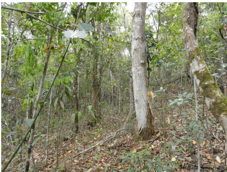
Aspecto do sub-bosque de fragmento em estágio avançado, Levantamento Florístico e Fitosociológico da BR-262/MG, Outubro de 2014.