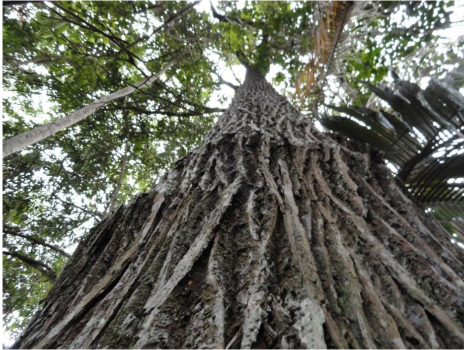
Indivíduo adulto de Lecyhtis pisonis (sapucaia) em fragmento em estágio avançado, Levantamento Florístico e Fitosociológico da BR-262/MG, Outubro de 2014.