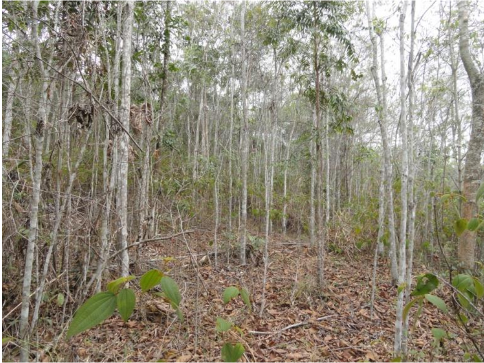
Aspecto dos caules finos e agrupados de um fragmento em estágio médio, Levantamento Florístico e Fitossociológico da BR-262/MG, Outubro de 2014.