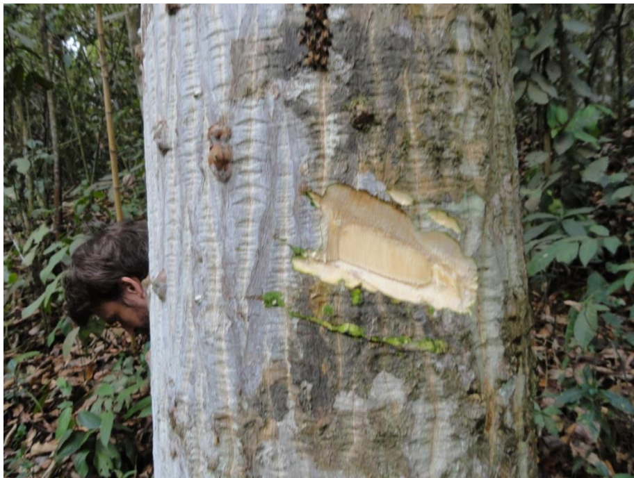
Aspecto de caule de Eriotheca candolleana com casca cortada para marcação da árvore e identificação, Levantamento Florístico e Fitossociológico da BR-262/MG, Outubro de 2014.