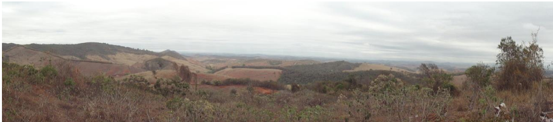
Panorâmica de região de pastagens com fragmento florestais, Levantamento Florístico e Fitossociológico da BR-262/MG, Outubro de 2014.