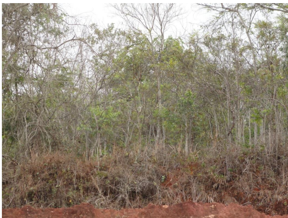
Aspecto externo de fragmento em estágio inicial de regeneração (Parcela 04), Levantamento Florístico da BR-262/MG, Outubro de 2014.