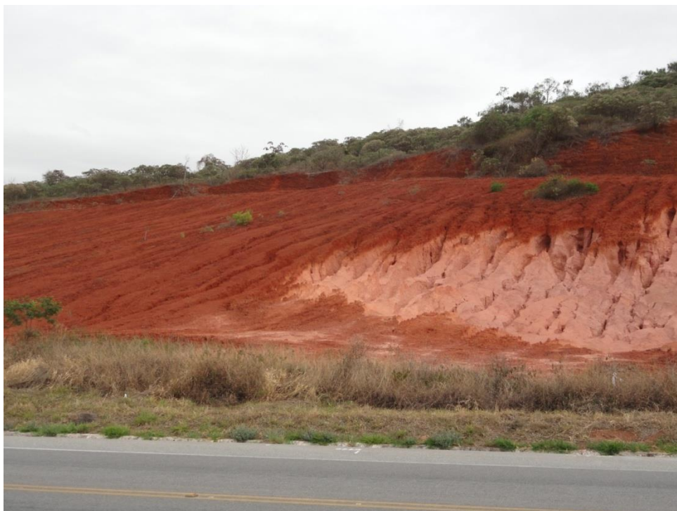
Aspecto de talude na beira da rodovia com intenso processo erosivo, Levantamento Florístico e Fitossociológico da BR-262/MG, Outubro de 2014.