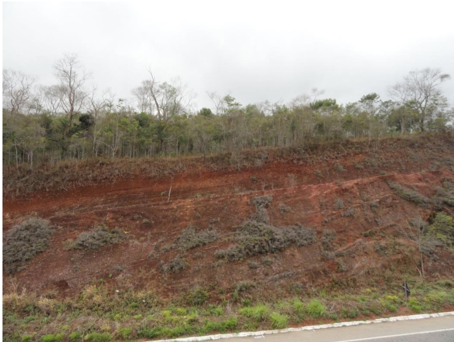
Aspecto de talude nas margens da rodovia, Levantamento Florístico e Fitossociológico da BR-262/MG, Outubro de 2014.