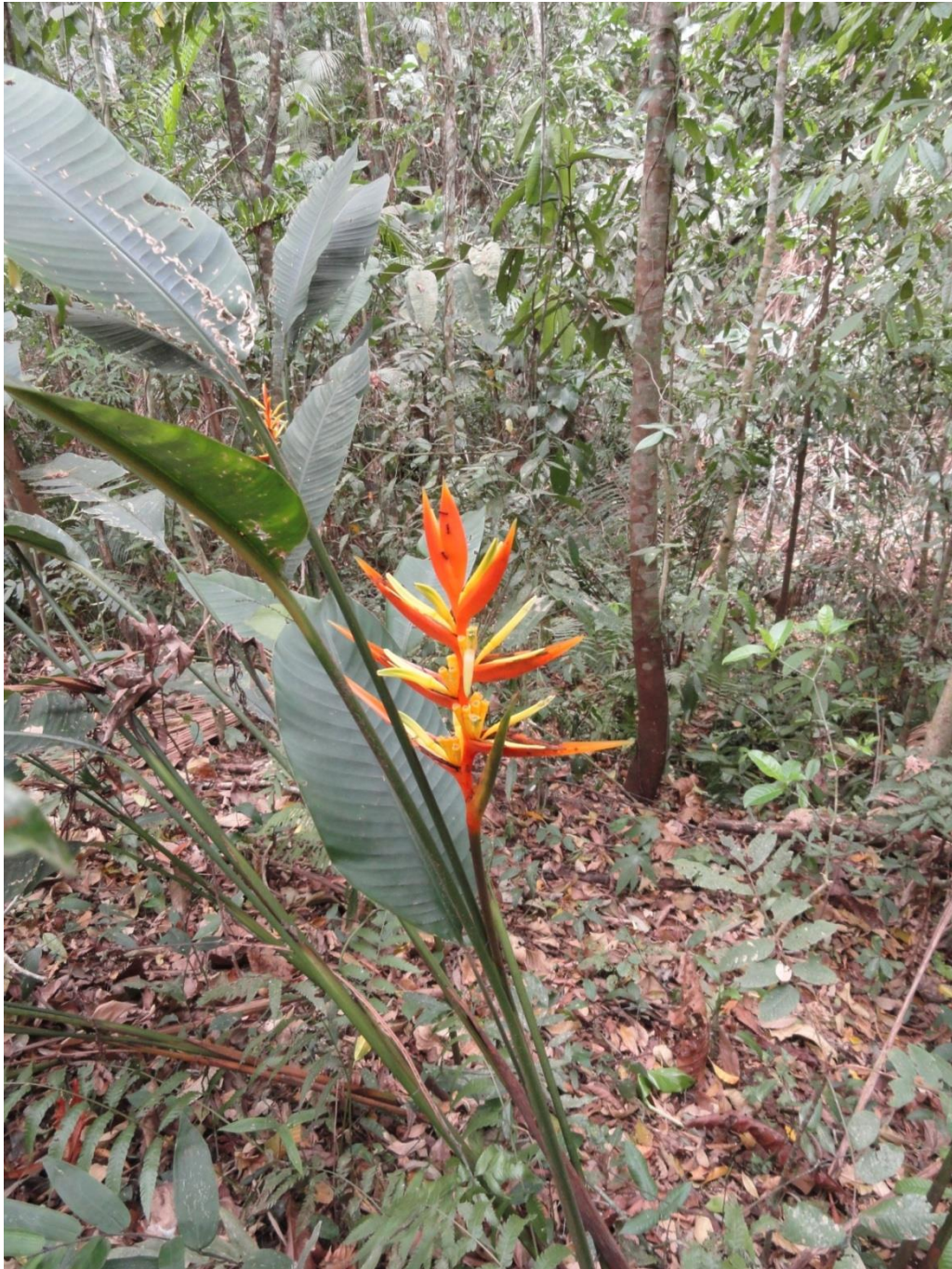
Indivíduo de Heliconia angusta (caeté) encontrada no interior de fragmento em estágio avançado de regeneração, Levantamento Florístico e Fitossociológico da BR-262/MG, Outubro de 2014.