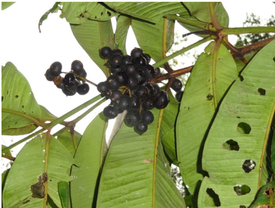
Myrtaceae com frutos maduros nas adjacências da Parcela 03 (provavelmente uma Marlierea sp.), Levantamento Florístico e Fitossociológico da BR-262/MG, Outubro de 2014.