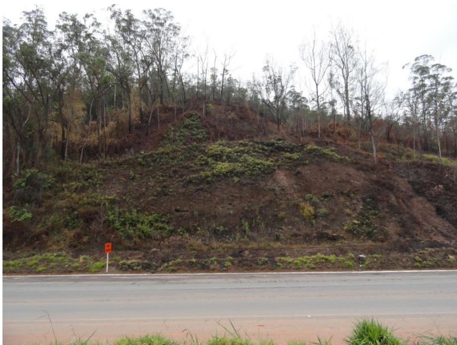
Aspecto geral de área queimada nas margens da rodovia, Levantamento Florístico e Fitossociológico da BR-262/MG, Outubro de 2014.