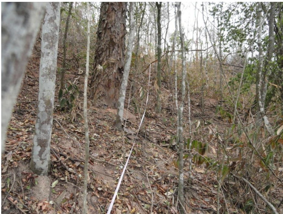
Unidade amostral (parcela) instalada em fragmento atingido pelo fogo, Levantamento Florístico e Fitossociológico da BR-262/MG, Outubro de 2014.