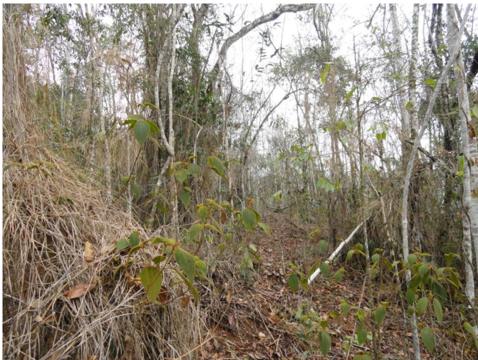
Sub-bosque de um fragmento com predomínio de Scleria secans e Clidemia hirta , Levantamento Florístico e Fitossociológico da BR-262/MG, Outubro de 2014.