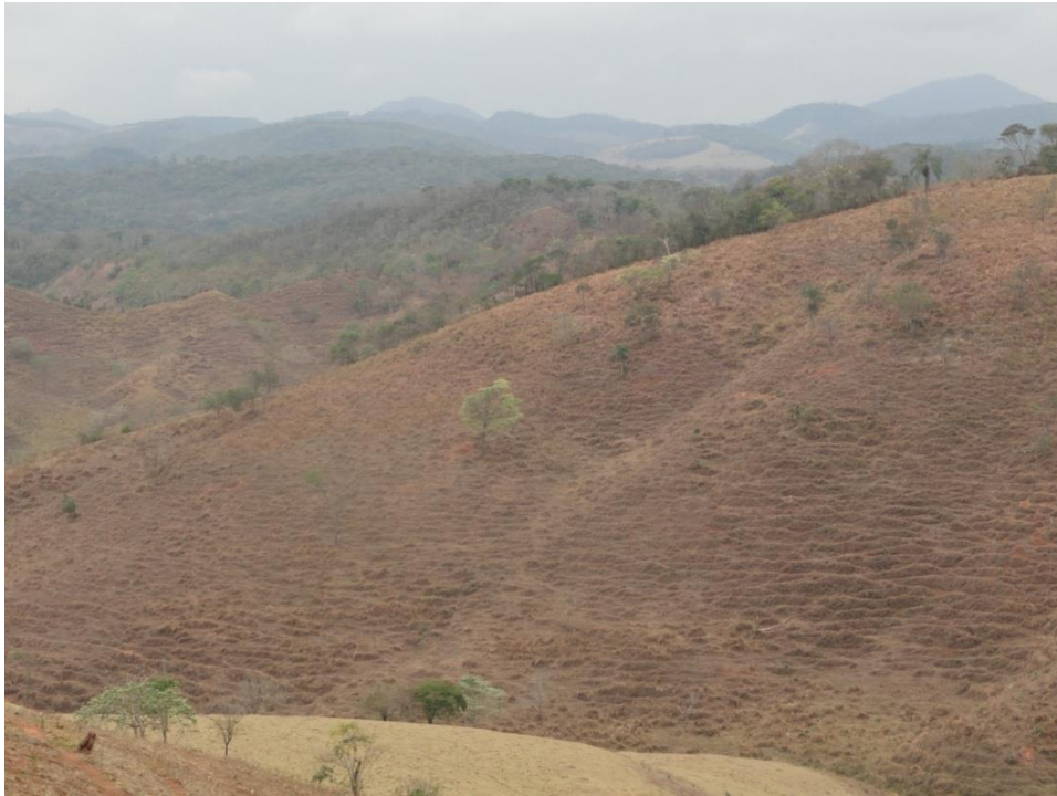
Aspecto geral da paisagem com destaque para a presença de fumaça resultante das queimadas, Levantamento Florístico e Fitossociológico da BR-262/MG, Outubro de 2014.