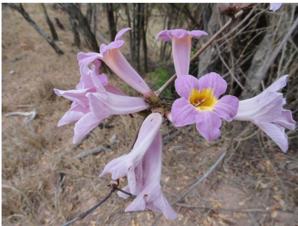
Flores de Bignoniaceae encontrada em borda de pastagem, Levantamento Florístico e Fitossociológico da BR-262/MG, Outubro de 2014.