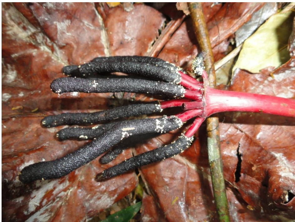
Infrutecência de Cecropia hololeuca , Levantamento Florístico e Fitossociológico da BR-262/MG, Outubro de 2014.