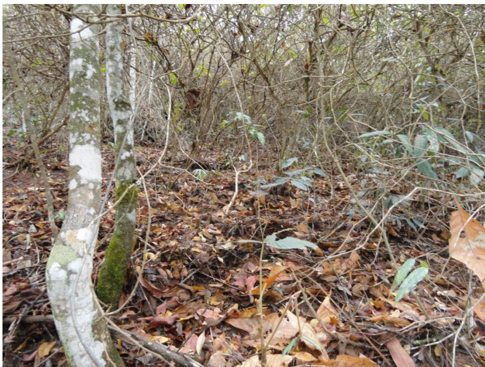
Aspecto dos caules retorcidos e ramificados dos arbustos de um fragmento em estágio inicial, Levantamento Florístico e Fitossociológico da BR-262/MG, Outubro de 2014.