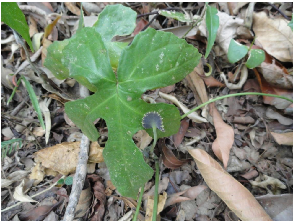
Indivíduo de Dorstenia vitifolia no interior de fragmento em estágio avançado de regeneração, Levantamento Florístico e Fitossociológico da BR-262/MG, Outubro de 2014.