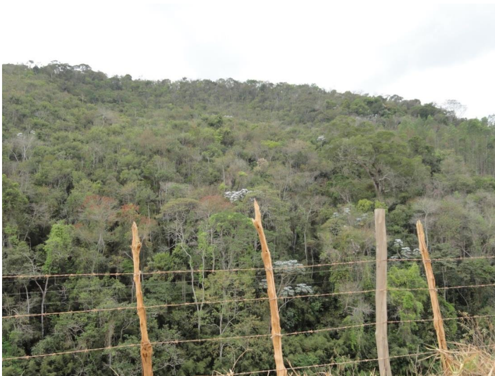
Aspecto externo de fragmento com grande parte do dossel sem folhas, Levantamento Florístico e Fitossociológico da BR-262/MG, Outubro de 2014.