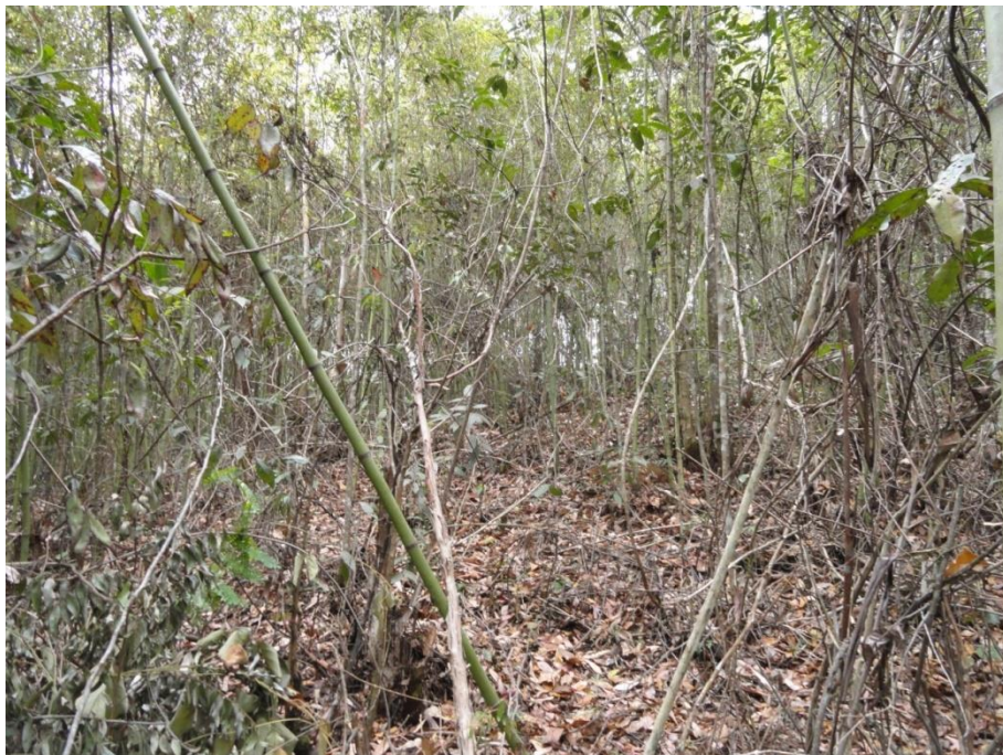
Aspecto geral do sub-bosque da Parcela 02 com destaque para a abundante serapilheira, Levantamento Florístico e Fitossociológico da BR-262/MG, Outubro de 2014.