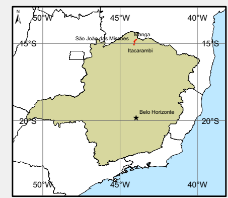
Localização do Empreendimento no Estado