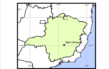
Localização no Estado de Minas Gerais