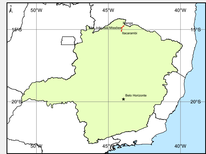
Localização no Estado de Minas Gerais