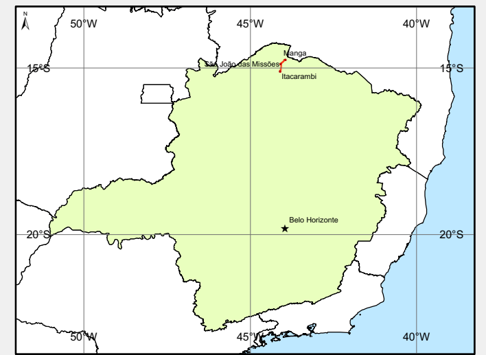
Localização no Estado de Minas Gerais