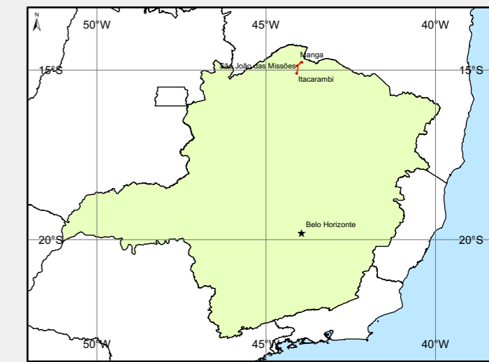
Localização no Estado de Minas Gerais