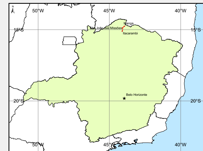
Localização no Estado de Minas Gerais