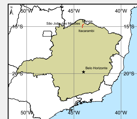
Localização do Empreendimento no Estado