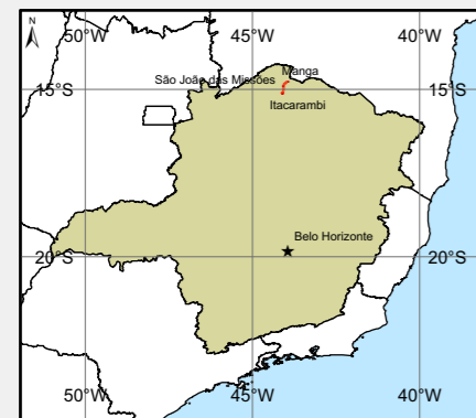
Localização do Empreendimento no Estado