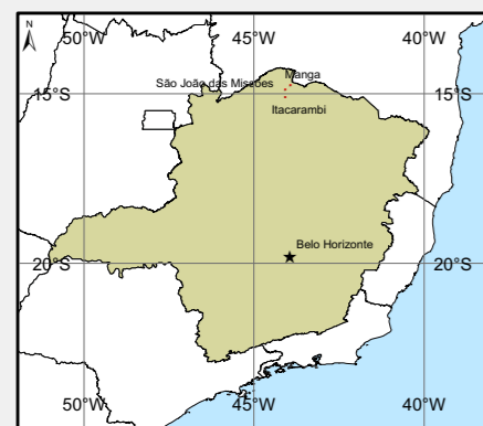
Localização do Empreendimento no Estado