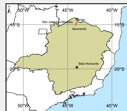
Localização do Empreendimento no Estado