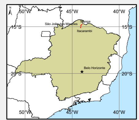
Localização no Estado de Minas Gerais