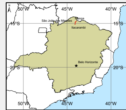
Localização do Empreendimento no Estado