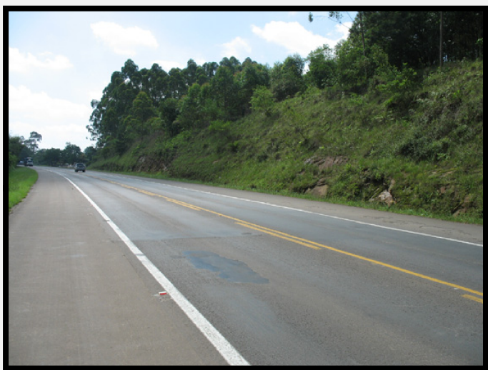
Passivo Ambiental Meio Físico nº 07 Corte de estrada