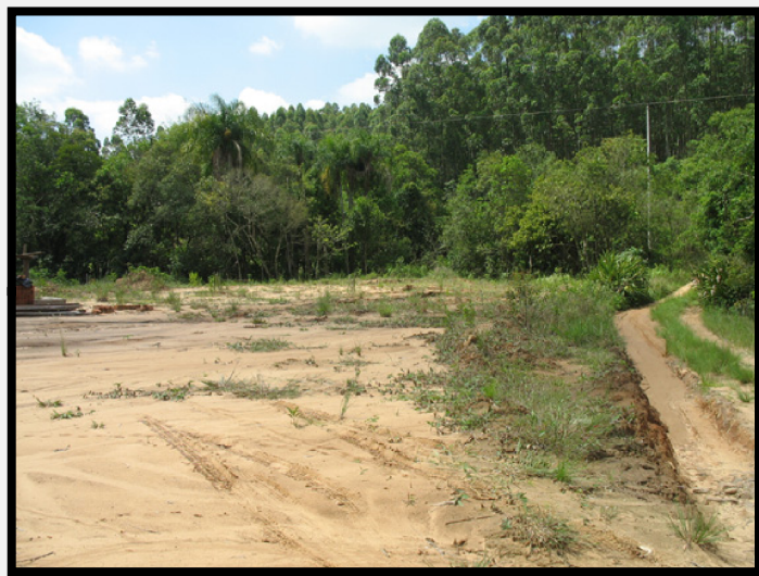
Passivo Ambiental Meio Físico nº 06 Área com extração de areia