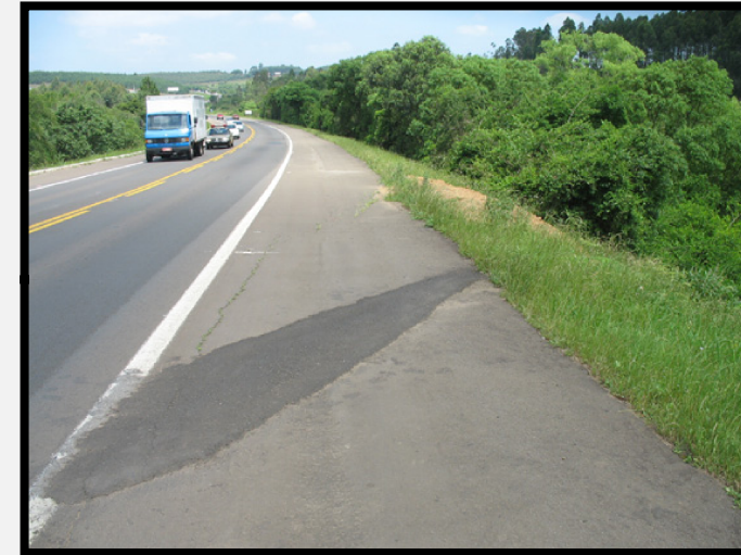
Passivo Ambiental Meio Físico nº 05 Aterro de estrada