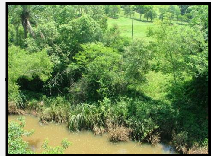
Passivo Ambiental Meio Biótico nº 02 Ocupação da APP do arroyo Concórdia