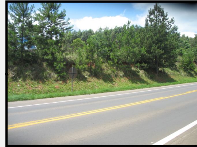
Passivo Ambiental Meio Físico nº 04 Corte de estrada