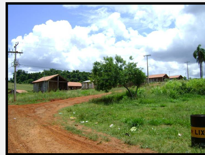
Passivo Ambiental Meio Socioeconômico nº 02 Acampamento indígena às margens da rodovia