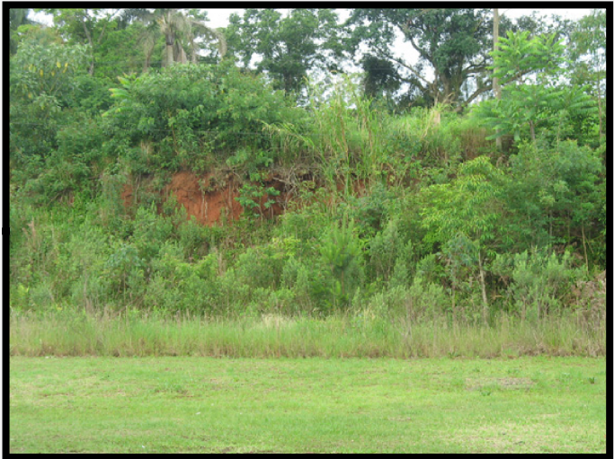
Passivo Ambiental Meio Físico nº 03 Corte de estrada