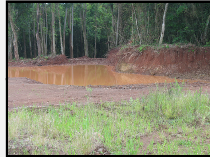
Passivo Ambiental Meio Físico nº 02 Área com extração de saibro e argila