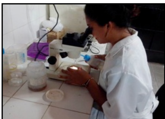
Triagem e identificação das amostras biológicas.