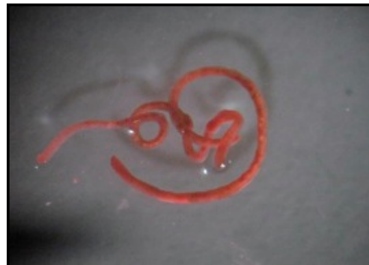
Naididae sp. 1