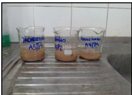
Lavagem das amostras durante processamento granulométrico