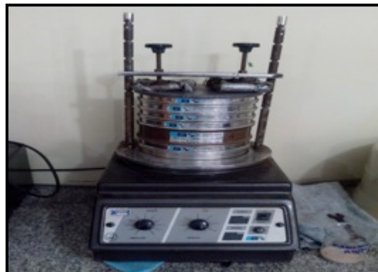
Pesagem das frações silte e argila durante processamento granulométrico