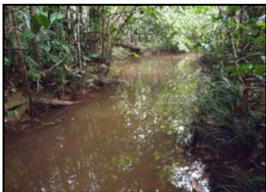
Igarapé Dunga, Área 2. Nota-se que o nível das águas está bastante reduzido.