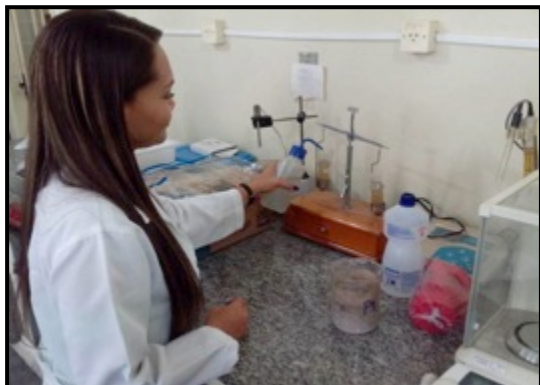
Pesagem das frações silte e argila durante processamento granulométrico.