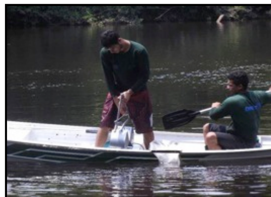
Coleta das amostras no Igarapé Manézinho utilizando a draga tipo Petersen.