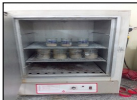
Secagem das amostras durante processamento granulométrico.