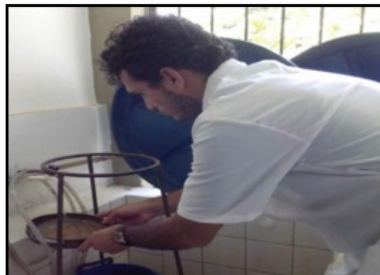
Lavagem das amostras biológicas.