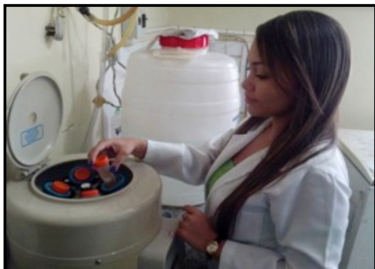
Centrifugação das frações silte e argila durante processamento granulométrico