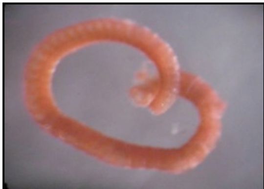
Naididae sp. 2