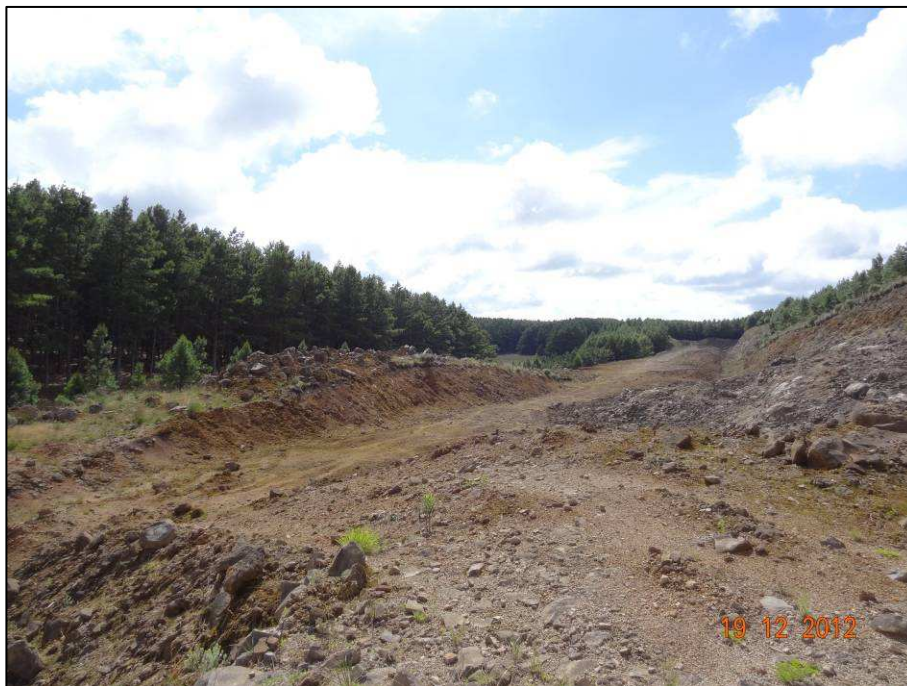
Figura 1 – Coordenada geográfica 28°45'36.17" S, 50°0'41.89" W, correspondente ao início do trecho de implantação do novo traçado.