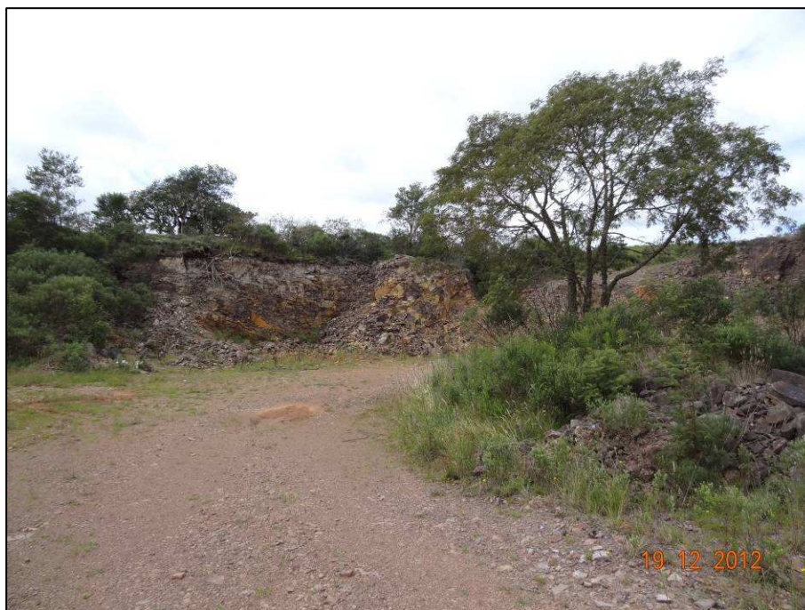
Figura 5 – Coordenada geográfica 28°46'57.02" S, 49°59'48.83" W, outra porção da cascalheira (01) a ser recuperada, localizada antes do rio das Antas, no sentido São José dos Ausentes a Divisa RS/SC.