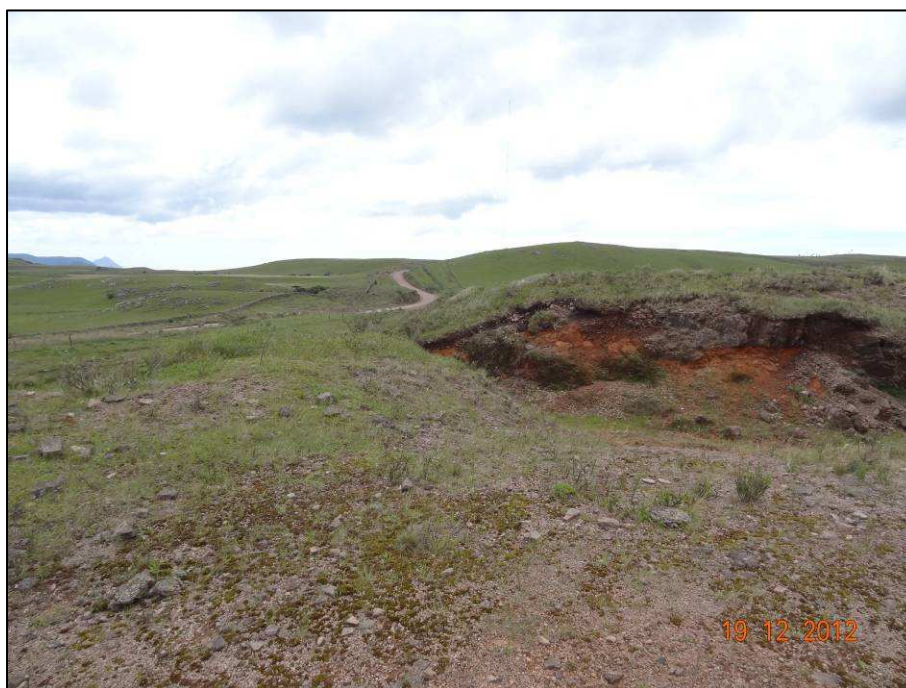
Figura 10 – Coordenada geográfica 28°47'35.92" S, 49°58'18.52" W, outra porção da cascalheira (03) a ser recuperada, localizada após o rio das Antas, no sentido São José dos Ausentes a Divisa RS/SC. Observe-se a localização da estrada existente.