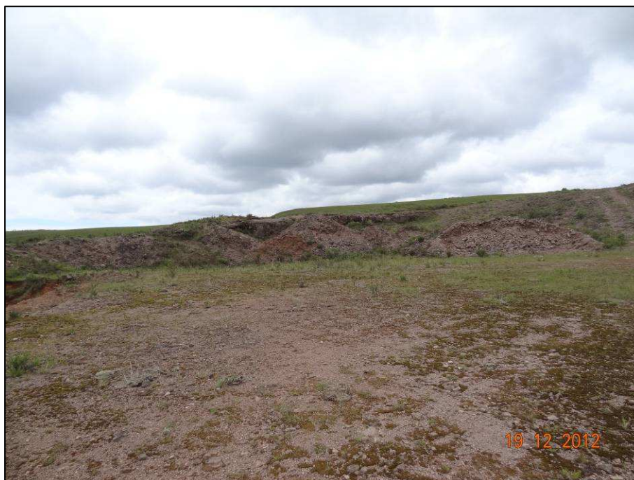
Figura 9 – Coordenada geográfica 28°47'35.83" S, 49°58'18.62" W, cascalheira (03) a ser recuperada, localizada após o rio das Antas, no sentido São José dos Ausentes a Divisa RS/SC.