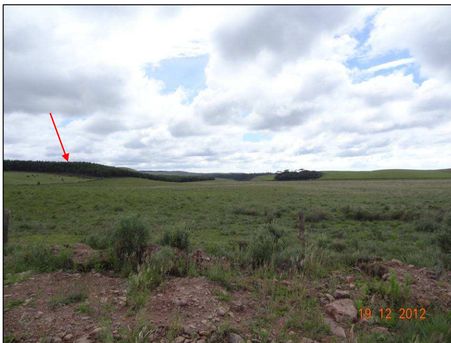
Figura 2 – Coordenada geográfica 28°46'17.08" S, 50°0'28.45" W, vista a partir da estrada existente, da área de cultivo de pinus que terá uma porção suprimida para implantação do novo traçado.