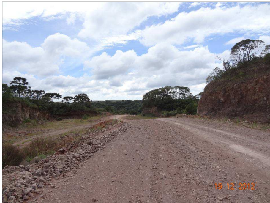
Figura 3 – Coordenada geográfica 28°46'56.05" S, 49°59'51.68" W, cascalheira (01) a ser recuperada, localizada antes do rio das Antas, no sentido São José dos Ausentes a Divisa RS/SC.