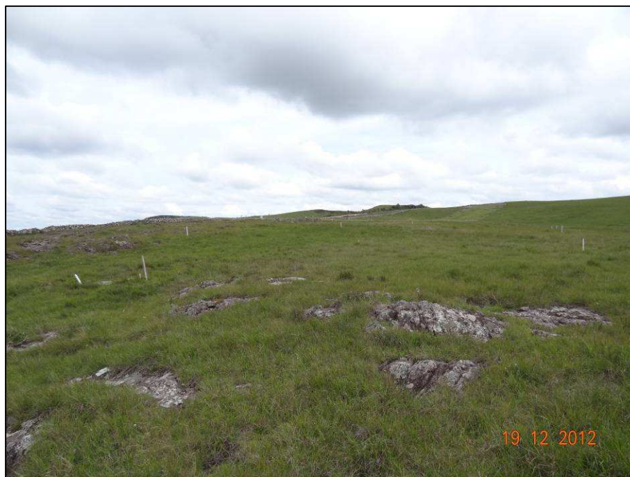
Figura 13 – Coordenada geográfica 28°47'56.78" S, 49°57'14.22" W, detalhe do estaqueamento do final do trecho de implantação do novo traçado da BR 285/RS.