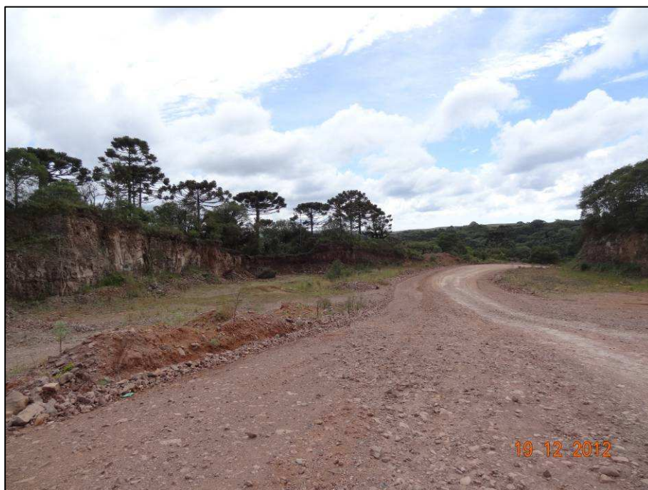
Figura 4 – Coordenada geográfica 28°46'56.11" S, 49°59'50.21" W, porção da cascalheira (01) a ser recuperada, localizada antes do rio das Antas, no sentido São José dos Ausentes a Divisa RS/SC.