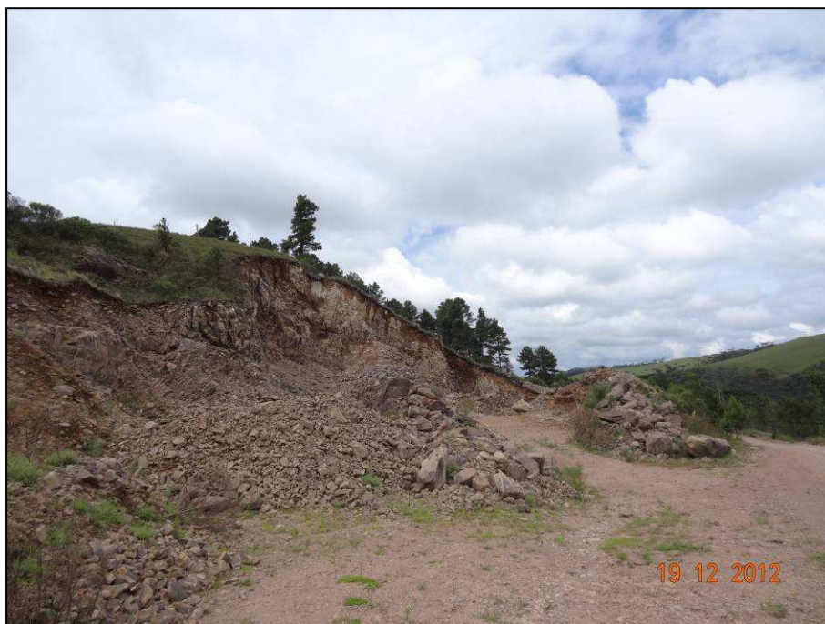
Figura 7 – Coordenada geográfica 28°47'26.29" S, 49°58'54.34" W, cascalheira (02) a ser recuperada, localizada após o rio das Antas, no sentido São José dos Ausentes a Divisa RS/SC.