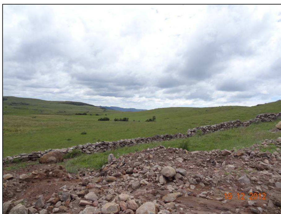
Figura 12 – Coordenada geográfica 28°47'34.59" S, 49°58'1.34" W, vista parcial do local de implantação do novo traçado da BR 285/RS.