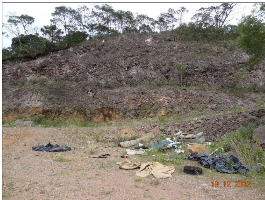
Figura 6 – Coordenada geográfica 28°46'57.68" S, 49°59'48.79" W, porção interna da cascalheira (01) a ser recuperada, localizada antes do rio das Antas, no sentido São José dos Ausentes a Divisa RS/SC, onde se observa a disposição indevida de lixo.