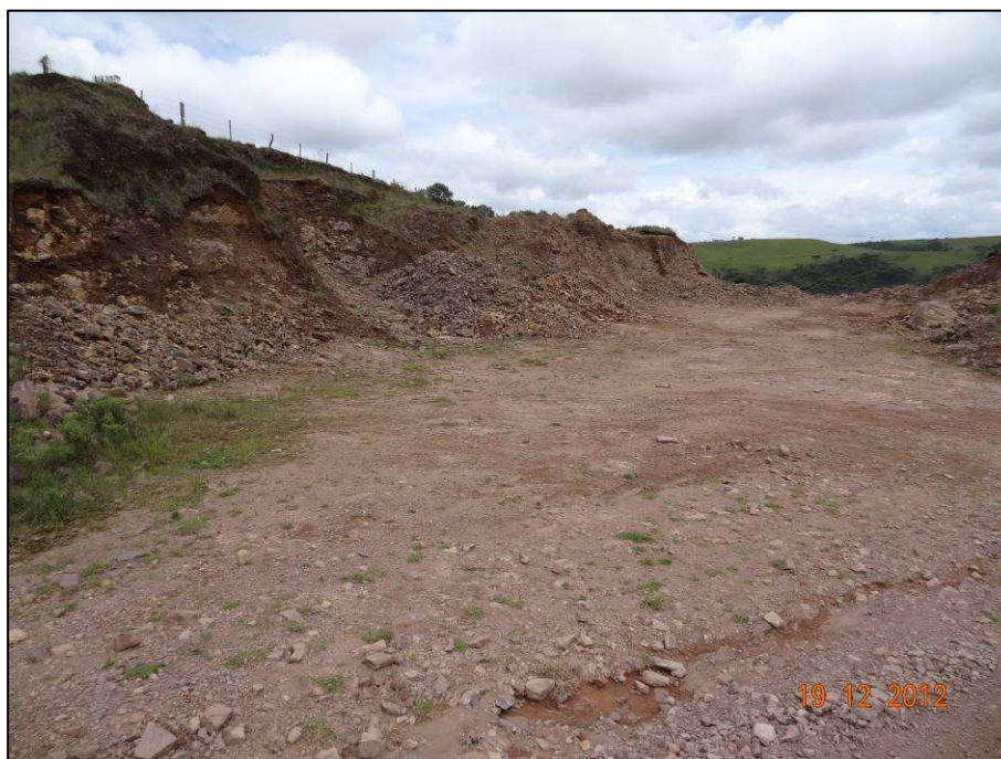
Figura 8 – Coordenada geográfica 28°47'28.02" S, 49°58'50.65" W, outra porção da cascalheira (02) a ser recuperada, localizada após o rio das Antas, no sentido São José dos Ausentes a Divisa RS/SC.