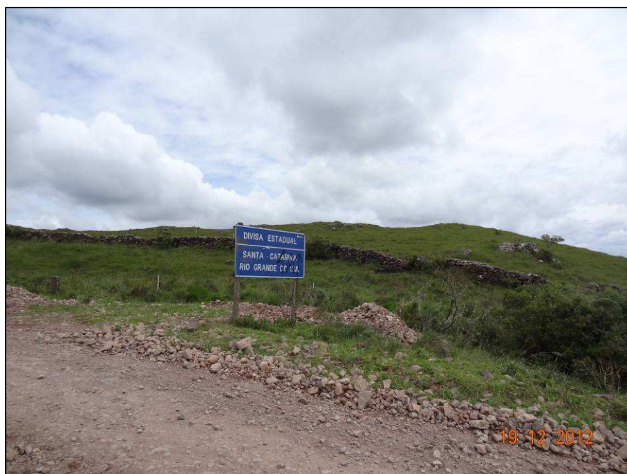
Figura 14 – Coordenada geográfica 28°47'58.34" S, 49°57'11.77" W, detalhe da placa informativa de Divisa Estadual - Santa Catarina e Rio Grande do Sul.