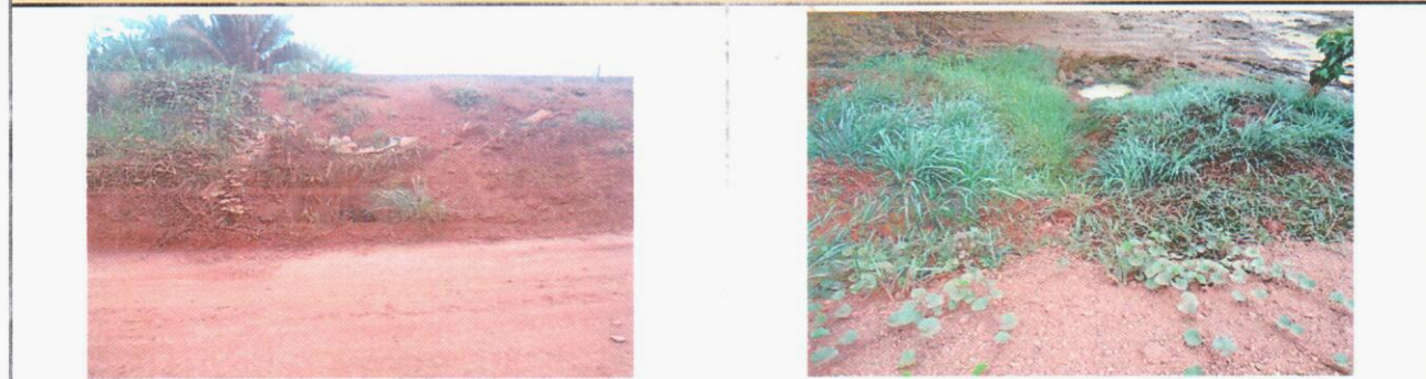
Foto 01 - Obstrução de bueiro.