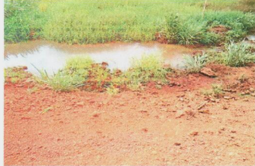
Foto 02 - Material desprendido para o corpo hídrico.