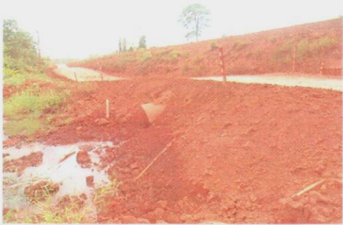
Foto 01 - Sedimentos existentes obstruindo a boca do bueiro.