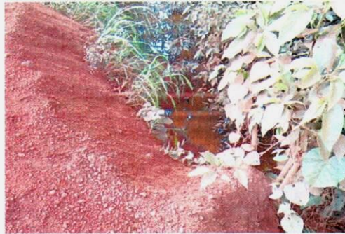
Foto 02 - Material de terraplanagem disposto para o corpo hídrico