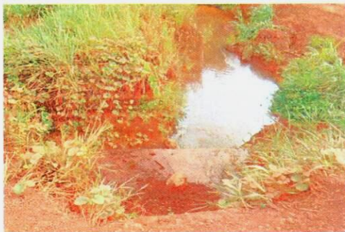
Foto 01 - Área de intervenção com vegetação removida