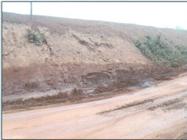
Foto 1 – Obstrução de bueiro. Lado: Esquerdo. Estaca: 4131. S 03. 44822° W 052. 91297° 18/10/2012

O Consórcio Ambiental BR-230/422/PA, portador do contrato N° PP 508/2011, cujo objeto é a execução dos Serviços de Gestão Ambiental, abrangendo a Supervisão Ambiental, a Implementação de Programas Ambientais e Gerenciamento Ambiental das Obras de Implantação e Pavimentação nas Rodovias BR-230/PA e BR-422/PA, incluindo obras-de-arte especiais, em atendimento ao estipulado no Edital de Licitação 609/2009, atesta que a empresa SANCHES TRIPOLONI ENCONTRA-SE EM CONFORMIDADE COM OS SERVIÇOS AMBIENTAIS referente ao Comunicado de Não Conformidade Ambiental (CNC) N° 23/2012, que refere-se à obstrução de bueiro por material proveniente de serviço de terraplenagem e abertura de caminho de serviço. A construtora realizou a desobstrução do bueiro citado no referente comunicado.