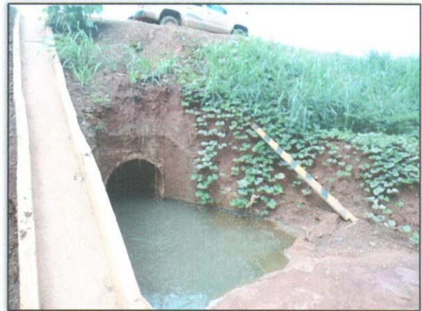
Foto 2 – Desobstrução de bueiro. Lado: Esquerdo. Estaca 4131. S 03. 44822° W 052. 91297° 13/02/2013.