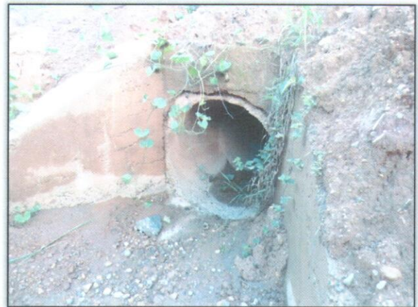
Foto 2 – Desobstrução do bueiro. Lado: Direito. Estaca: 3048. S 03.39630° W 052.73100° 13/02/2013