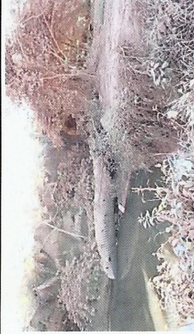
Foto 01 - Bueiro metálico em APP.