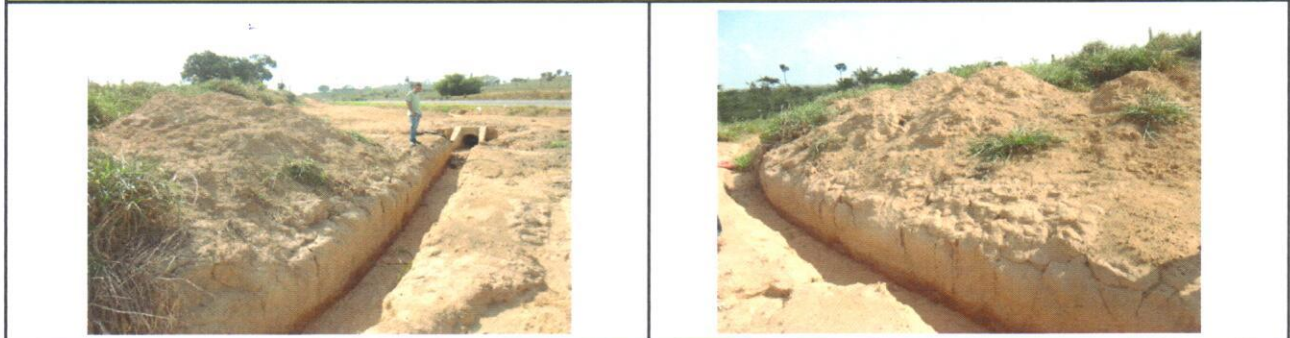
Foto 01 - Vista do bueiro com o material excedente de escavação (lado esquerdo).