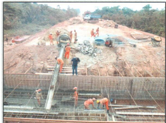
Foto 02 – Material retirado pela construtora. Estaca 2542. Lado esquerdo. S 03.23188° W 051.49794°. 04/09/2012