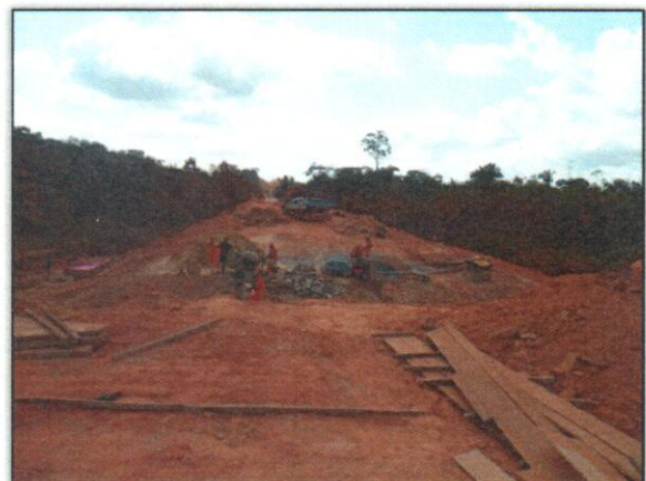
Foto 04 – Material retirado da faixa de domínio. Estaca 2542. Lado esquerdo. S 03.23188° W 051.49794°. 04/09/2012