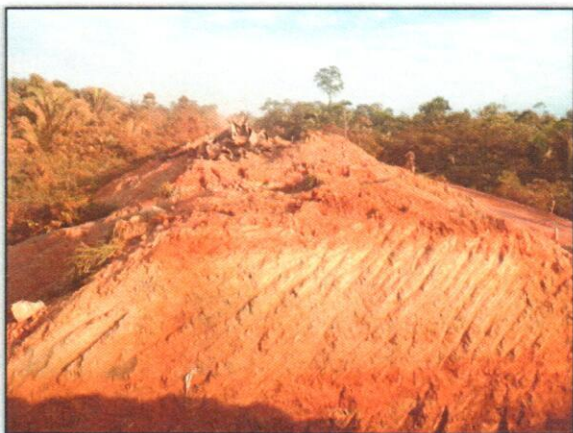
Foto 03 - Restos de bueiro metálico na faixa de domínio. Estaca 2542. Lado esquerdo. S 03.23188° W 051.49794°. 08/08/2012