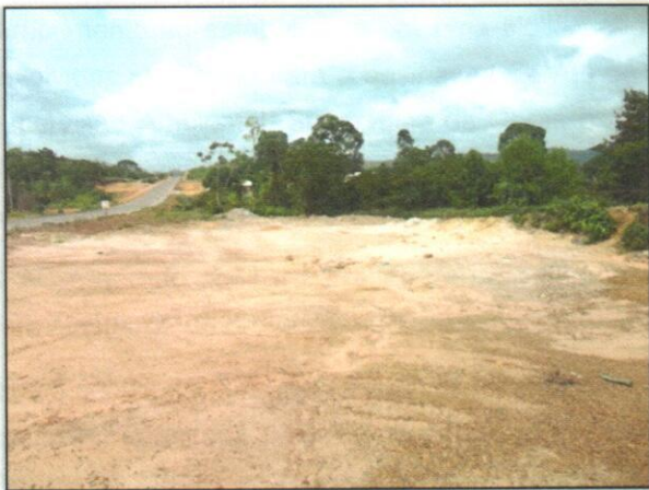
Foto 03 – Material excedente de construção. Estaca 5914. Lado Direito. S 03.15526° W 051.98801°. 08/12/2011.

O Consórcio Ambiental BR-230/422/PA, portador do contrato Nº PP 508/2011, cujo objeto é a execução dos Serviços de Gestão Ambiental, abrangendo a Supervisão Ambiental, a Implementação de Programas Ambientais e Gerenciamento Ambiental das Obras de Implantação e Pavimentação nas Rodovias BR-230/PA e BR-422/PA, incluindo obras-de-arte especial, em atendimento ao estipulado no Edital de Licitação 609/2009, atesta que a empresa TORC ENCONTRA-SE EM CONFORMIDADE COM OS SERVIÇOS AMBIENTAIS referentes à Comunicação de Não-Conformidade (CNC). Nº 015/2011. Esse comunicado advertia sobre material excedente de construção.