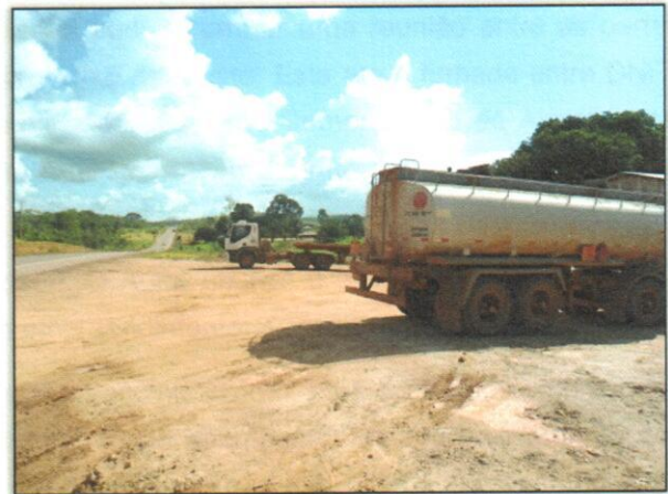
Foto 04 – O material foi removido pelo proprietário da oficina instalada recentemente no local da vistoria. Estaca 5914. Lado Direito. S 03.15526° W 051.98801°. 28/06/2012.