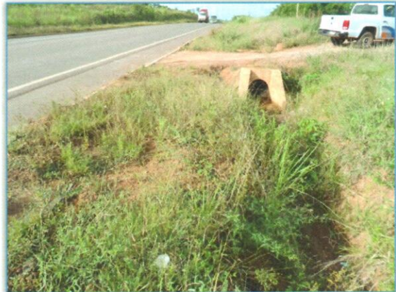
Foto 04 - Realizado hidrossemeadura, condução da regeneração natural e retirada do material excedente. Estaca 6008 Lado Esquerdo. S 03.16281° W 052.00312° 04/06/2012