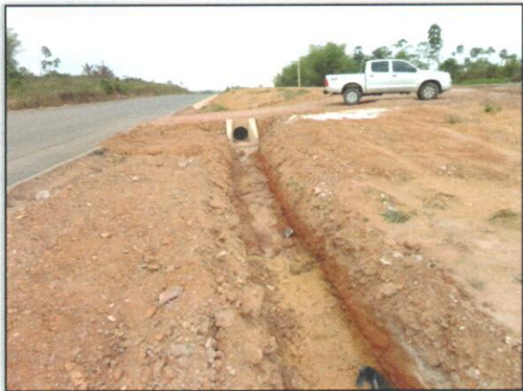
Foto 01 – Material excedente de escavação. Estaca 6008 Lado Esquerdo. S 03.16281° W 052.00312° 07/12/2011

O Consórcio Ambiental BR-230/422/PA, portador do contrato Nº PP 508/2011, cujo objeto é a execução dos Serviços de Gestão Ambiental, abrangendo a Supervisão Ambiental, a Implementação de Programas Ambientais e Gerenciamento Ambiental das Obras de Implantação e Pavimentação nas Rodovias BR-230/PA e BR-422/PA, incluindo obras-de-arte especial, em atendimento ao estipulado no Edital de Licitação 609/2009, atesta que a empresa TORC ENCONTRA-SE EM CONFORMIDADE COM OS SERVIÇOS AMBIENTAIS referentes à Comunicação de Não-Conformidade (CNC). Nº 011/2011. Esse comunicado advertia sobre o material excedente de escavação próximo do dispositivo de drenagem.