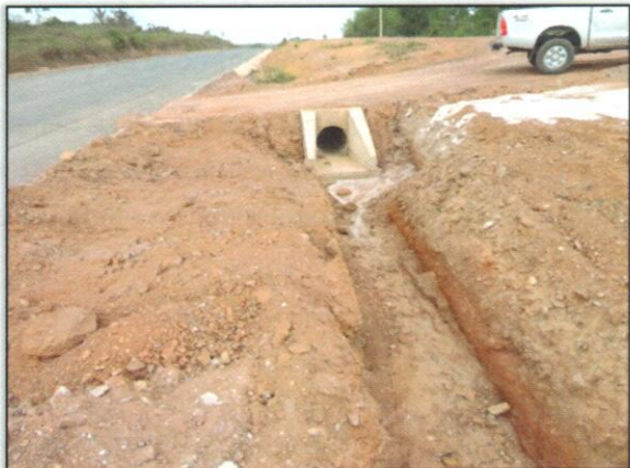
Foto 03 – Material excedente de escavação. Estaca 6008 Lado Esquerdo. S 03.16281° W 052.00312° 07/12/2011