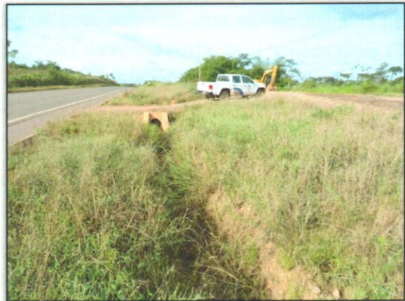
Foto 02 - Foi realizado hidrossemeadura e condução da regeneração natural. Estaca 6008 Lado Esquerdo. S 03.16281° W 052.00312° 04/06/2012