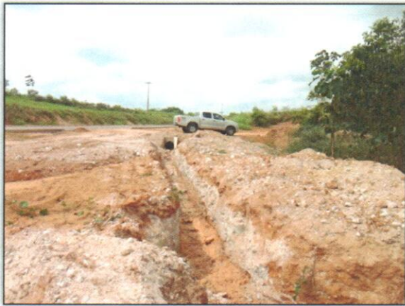
Foto 01 – Material excedente de escavação. Estaca 5832 Lado Direito. S 03.148898° W 051.974653° 08/12/2011.

O Consórcio Ambiental BR-230/422/PA, portador do contrato Nº PP 508/2011, cujo objeto é a execução dos Serviços de Gestão Ambiental, abrangendo a Supervisão Ambiental, a Implementação de Programas Ambientais e Gerenciamento Ambiental das Obras de Implantação e Pavimentação nas Rodovias BR-230/PA e BR-422/PA, incluindo obras-de-arte especial, em atendimento ao estipulado no Edital de Licitação 609/2009, atesta que a empresa TORC ENCONTRA-SE EM CONFORMIDADE COM OS SERVIÇOS AMBIENTAIS referentes à Comunicação de Não-Conformidade (CNC). Nº 018/2011. Esse comunicado advertia sobre o material excedente de escavação e material sufocando a vegetação remanescente.