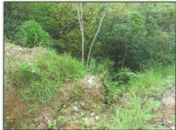
Foto 04 - Realizado hidrossemeadura e retirada do material. Estaca 5832 Lado Direito. S 03.148898° W 051.974653° 04/06/2012.