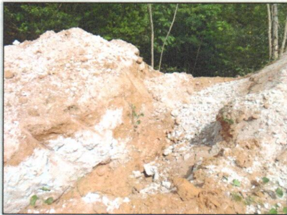
Foto 03 – Material excedente próximo à vegetação. Estaca 5832 Lado Direito. S 03.148898° W 051.974653° 08/12/2011.