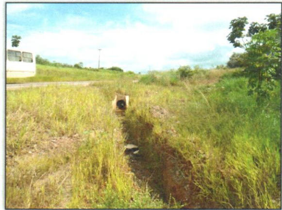
Foto 02 - Foi realizado hidrossemeadura e o material foi retirado. Estaca 5832 Lado Direito. S 03.148898° W 051.974653° 04/06/2012.