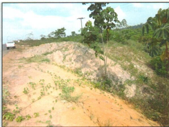
Foto 03 – Material excedente. Estaca 6040 Lado Esquerdo. S 03.166434° W 052.007578° 07/12/2011.