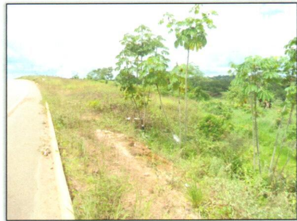
Foto 04 - Realizado hidrossemeadura, condução da regeneração natural e retirada do material. Estaca 6040 Lado Esquerdo. S 03.166434° W 052.007578° 04/06/2012.