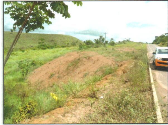
Foto 02 - Foi realizado hidrossemeadura e condução da regeneração natural para contenção da erosão. Estaca 6040 Lado Esquerdo. S 03.166434° W 052.007578° 04/06/2012.