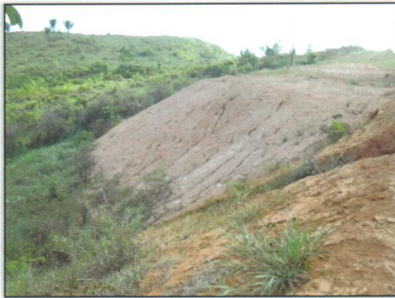
Foto 01 – Processos erosivos. Estaca 6040 Lado Esquerdo. S 03.166434° W 052.007578° 07/12/2011.

O Consórcio Ambiental BR-230/422/PA, portador do contrato Nº PP 508/2011, cujo objeto é a execução dos Serviços de Gestão Ambiental, abrangendo a Supervisão Ambiental, a Implementação de Programas Ambientais e Gerenciamento Ambiental das Obras de Implantação e Pavimentação nas Rodovias BR-230/PA e BR-422/PA, incluindo obras-de-arte especial, em atendimento ao estipulado no Edital de Licitação 609/2009, atesta que a empresa TORC ENCONTRA-SE EM CONFORMIDADE COM OS SERVIÇOS AMBIENTAIS referentes à Comunicação de Não-Conformidade (CNC). Nº 008/2011. Esse comunicado advertia sobre os processos erosivos e material excedente.