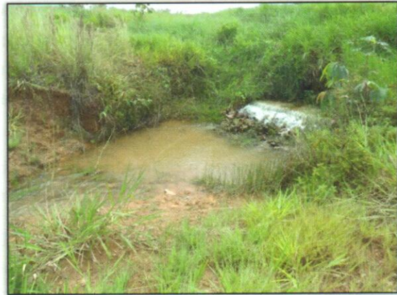
Foto 02 - Foi realizado hidrossemeadura e condução da regeneração natural. Estaca 6154 Lado Esquerdo. S 03.169761° W 052.027119° 04/06/2012