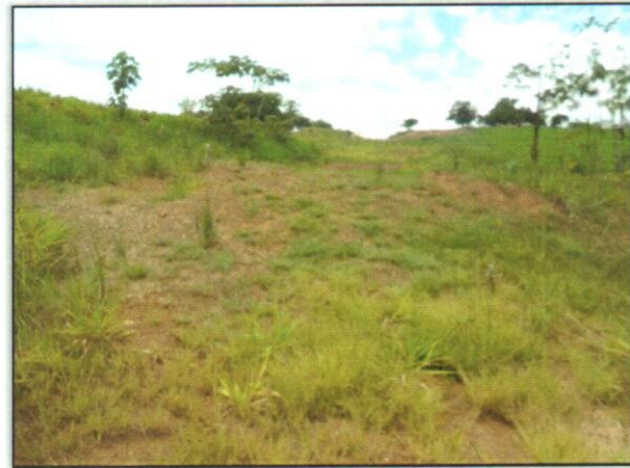
Foto 04 - Realizado hidrossemeadura, condução da regeneração natural para contenção da erosão. Estaca 6154 Lado Esquerdo. S 03.169761° W 052.027119° 04/06/2012