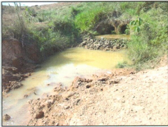
Foto 01 - Assoreamento do Corpo hídrico proveniente da erosão (Foto 03). Estaca 6154 Lado Esquerdo. S 03.169761° W 052.027119° 07/12/2011

O Consórcio Ambiental BR-230/422/PA, portador do contrato Nº PP 508/2011, cujo objeto é a execução dos Serviços de Gestão Ambiental, abrangendo a Supervisão Ambiental, a Implementação de Programas Ambientais e Gerenciamento Ambiental das Obras de Implantação e Pavimentação nas Rodovias BR-230/PA e BR-422/PA, incluindo obras-de-arte especial, em atendimento ao estipulado no Edital de Licitação 609/2009, atesta que a empresa TORC ENCONTRA-SE EM CONFORMIDADE COM OS SERVIÇOS AMBIENTAIS referentes à Comunicação de Não-Conformidade (CNC). Nº 006/2011. Esse comunicado advertia sobre o assoreamento do corpo hídrico proveniente de uma erosão na Área de Preservação Permanente - APP.