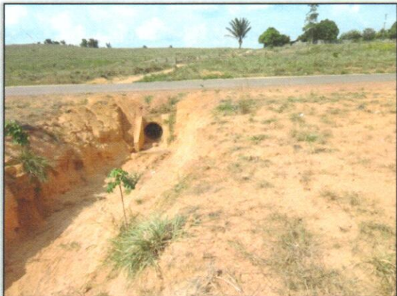
Foto 03 - Ausência de cobertura vegetal e processos erosões na ala do bueiro. Estaca 6200 Lado Esquerdo. S 03.169780° W 052.035398° 07/12/2011