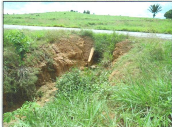
Foto 04 - Realizado hidrossemeadura, condução da regeneração natural. Estaca 6200 Lado Esquerdo. S 03.169780° W 052.035398° 04/06/2012