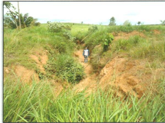
Foto 02 - Foi realizado hidrossemeadura e condução da regeneração natural. Estaca 6200 Lado Esquerdo. S 03.169780° W 052.035398° 04/06/2012