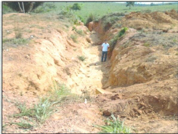
Foto 01 – Processos erosivos na boca do bueiro e nas suas alas. Estaca 6200 Lado Esquerdo. S 03.169780° W 052.035398° 07/12/2011

O Consórcio Ambiental BR-230/422/PA, portador do contrato N° PP 508/2011, cujo objeto é a execução dos Serviços de Gestão Ambiental, abrangendo a Supervisão Ambiental, a Implementação de Programas Ambientais e Gerenciamento Ambiental das Obras de Implantação e Pavimentação nas Rodovias BR-230/PA e BR-422/PA, incluindo obras-de-arte especial, em atendimento ao estipulado no Edital de Licitação 609/2009, atesta que a empresa TORC ENCONTRA-SE EM CONFORMIDADE COM OS SERVIÇOS AMBIENTAIS referentes à Comunicação de Não-Conformidade (CNC). N° 002/2011. Esse comunicado advertia sobre processos erosivos e ausência de vegetação.