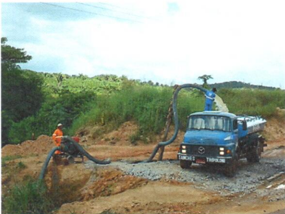
Foto 01 - (Antes) Captação de água sem licença. Estaca 3440. Lado direito S 04.13232° W 050.23882° 13/06/2013.

O Consórcio Ambiental BR-230/422/PA, detentor do contrato N° PP 508/2011, cujo objeto é a execução dos Serviços de Gestão Ambiental, abrangendo a Supervisão Ambiental, a Implementação de Programas Ambientais e Gerenciamento Ambiental das Obras de Implantação e Pavimentação nas Rodovias BR-230/PA e BR-422/PA, incluindo obras-de-arte especiais, em atendimento ao estipulado no Edital de Licitação 609/2009, atesta que a empresa Sanches Tripoloni ENCONTRA-SE EM CONFORMIDADE COM OS SERVIÇOS AMBIENTAIS referente à Notificação Ambiental (NA) N° 01/2013. Esse comunicado advertia sobre a captação de água sem apresentação da outorga ou dispensa. Foi suspensa a captação no referido ponto. Salientamos que a construtora não apresentou a Outorga ou a declaração de Dispensa de Outorga para este corpo hídrico. Caso seja verificada nova captação neste ponto, será emitida nova Notificação Ambiental.