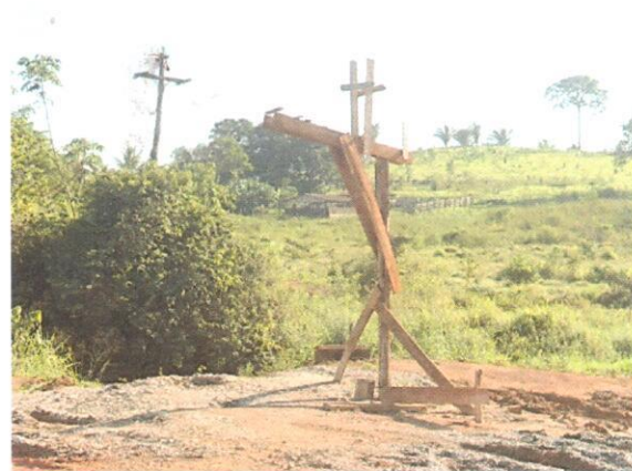
Foto 2 - (Depois) Bomba d'água retirada. Lado direito S 04.13232° W 050.23882° 24/07/2013.

A Comunicação de Não-Conformidade e a Notificação Ambiental encontram-se anexadas ao presente documento.