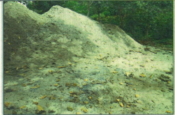
Foto 02 - Areia sem barreira de contenção. Lado Direito.