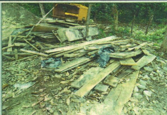
Foto 03 - Deposição inadequada de madeira. Lado direito